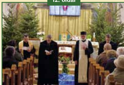
ÖKUMENIKUS IMAHÉT POMÁZON