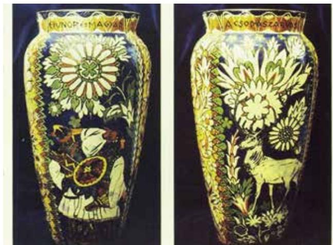
► Hunor és Magyar csodaszarvassal váza, 1928 (Magyar Nemzeti Múzeum)