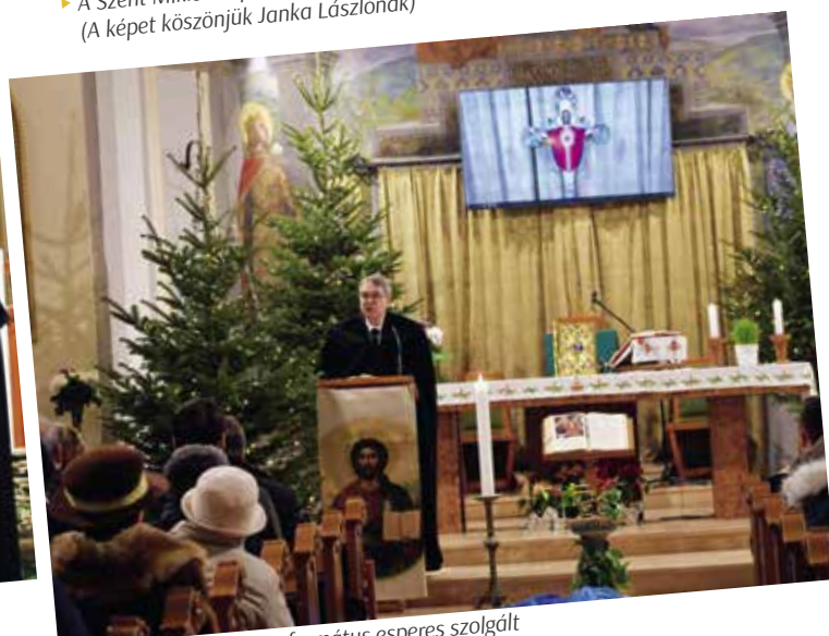
► ... ahol Nyilas Zoltán református esperes szolgált