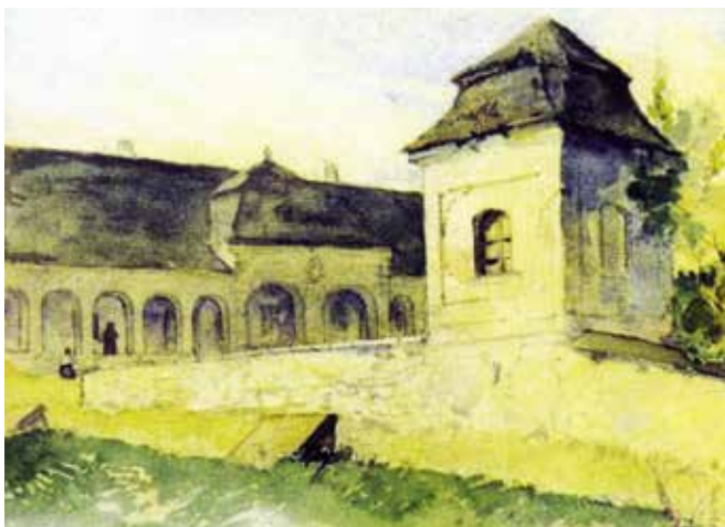
► Teleki-Wattay kastély 1921