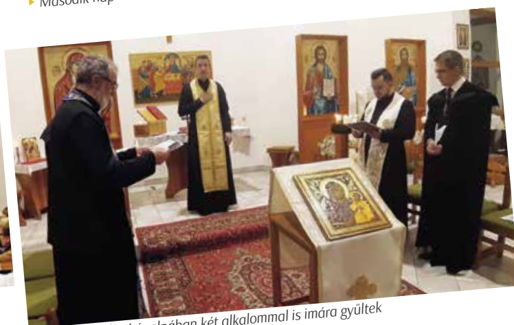
► A Szent Miklós kápolnában két alkalommal is imára gyűltek