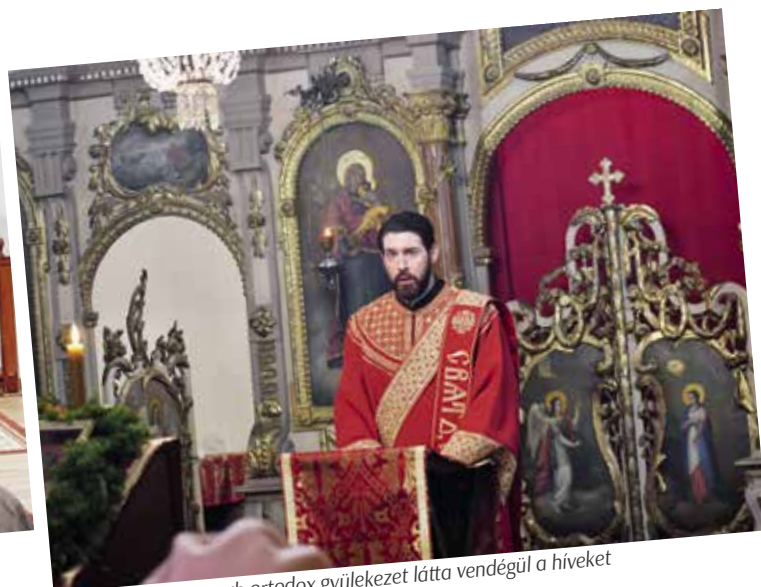
► Második nap a szerb ortodox gyülekezet látta vendégül a híveket