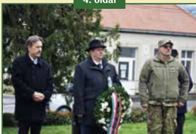
80 ÉVE TÖRTÉNT A DONI KATASZTRÓFA