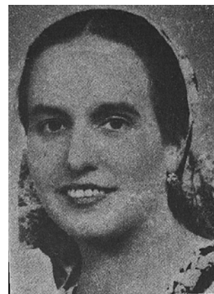
▶ Tüdös Klára

tudása és tudományszervezői munkássága nagy hatással volt a császárkor, majd később Róma egész történetének kutatására. Szerkesztette többek között a Numizmatikai Közlönyt, 1940-től az Archeológiai Értesítőt, 1949 és 1955 között a Dissertationes Berneuest, 1955–1965 az Antiquitast. Tagja volt a Pápai Régészeti Akadémiának, valamint a francia, az angol, a svéd, a dán és az osztrák tudományos akadémiáknak. Alföldi András életútja példaértékű, nem csupán annak bizonyítéka, hogy valaki a magyarországi tudományos életből hogyan juthat el következetes és precíz munka segítségével a tudományos világ megbecsült nagyságai közé, hanem annak is, hogy a 20. századi magyar történelem minden fordulata ellenére hogyan maradhat meg valaki, még hazájától is elszakítva, szülőföldjéhez hűséges.