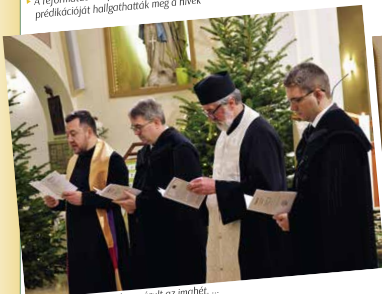
► A katolikus templomban zárult az imahét, ...