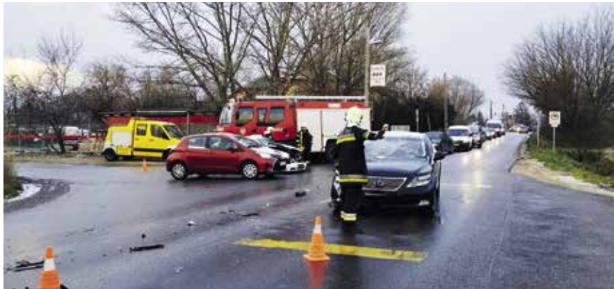
► Két autó ütközött a Szentendrei út és a Céhmaster utca találkozásánál

A pomázi önkéntes tűzoltók a sérült járműveket áramtalanították, majd a rendőrségi helyszínelés után megszüntették a forgalmi akadályt.