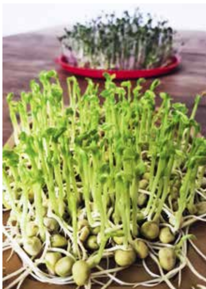
► Borsó mikrozöldek

– A kis növénykék nevelése nem igényel sok figyelmet , napi pár perc törődés pedig finom, vegyszermentes, és egészséges zöldség.