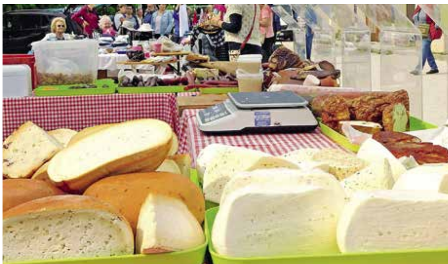
▶ A képeket köszönjük Czímer Mihálynak

Minden hónap első szombatján a termelői piac Piaci bazárrá bővül, ahol sokféle tárgy, ruha, könyv és más portéka talál vevőre. Emellett immár évek óta tartó hagyományként ekkor van a képviselői reggeli is, ahol a helyi önkormányzati képviselőkkel találkozhatnak, beszélgethetnek egy könnyű reggeli, tea, kávé elfogyasztása mellett.