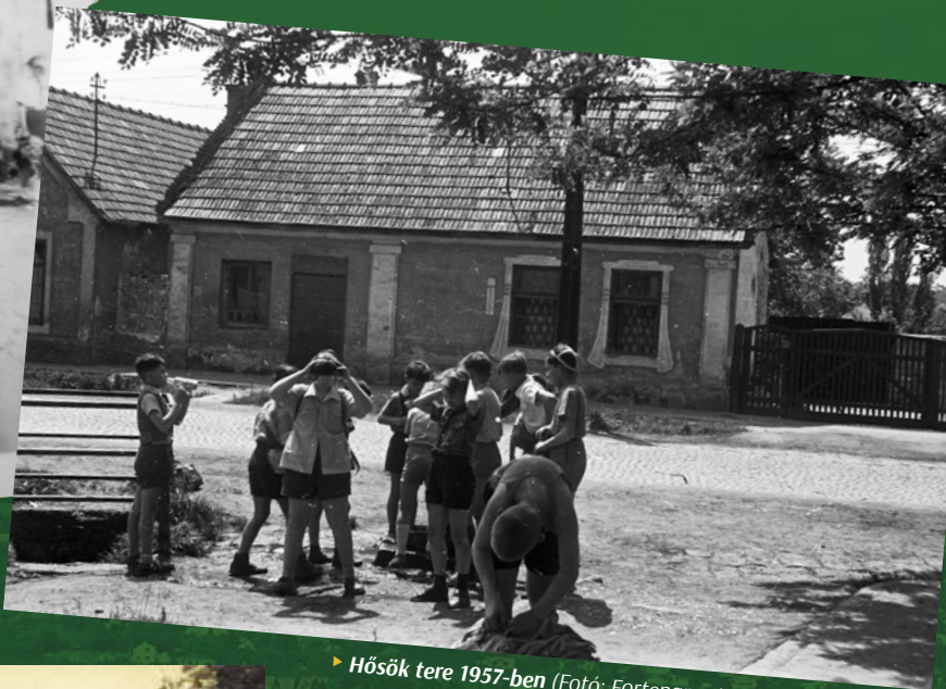
► Hősök tere 1957-ben