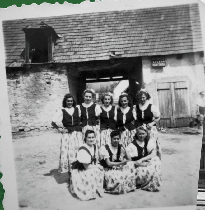
► Néptáncos lányok Pomáz község bikaistállója előtt (mai Városháza udvara) az 1950-es évek elején