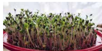
► Lucerna és karalábé mikrozöldek egy hét után