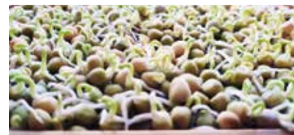
► Borsó csírák

– A nitrát tartalmuk jóval alacsonyabb , az anti-oxidáns tartalmuk pedig jóval magasabb , mint a hagyományos értelemben vett zöldségpárjaiké, ezért csökkentik a szabad gyökök negatív hatásait. – Egy-egy fajtának érdemes lehet utánanézni, mert a tápanyag- és vitamintartalom fajtánként eltér. A brokkoli esetében 100 gr mikrozöld 300 µg A vitamint (napi mennyiség 30%-át), 51 mg C vitamint (napi mennyiség 60%-át), 24 mg E vitamint (napi mennyiség 160%-át) tartalmaz.