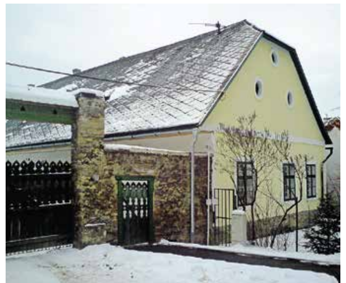
► Uradalmi ház