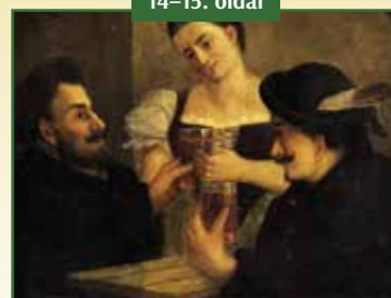
PETŐFI SÁNDOR LÁTOGATÁSA POMÁZON