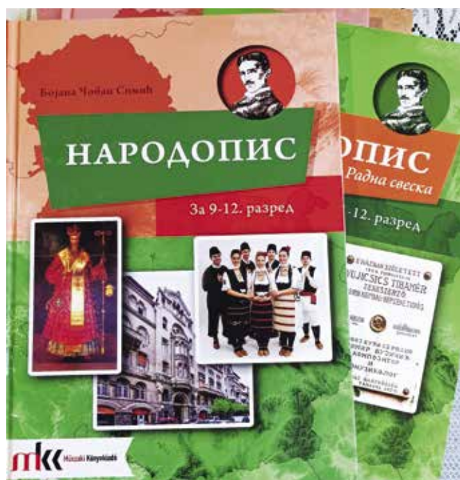
► Szerb nemzetiségi oktatásban használt tankönyvek