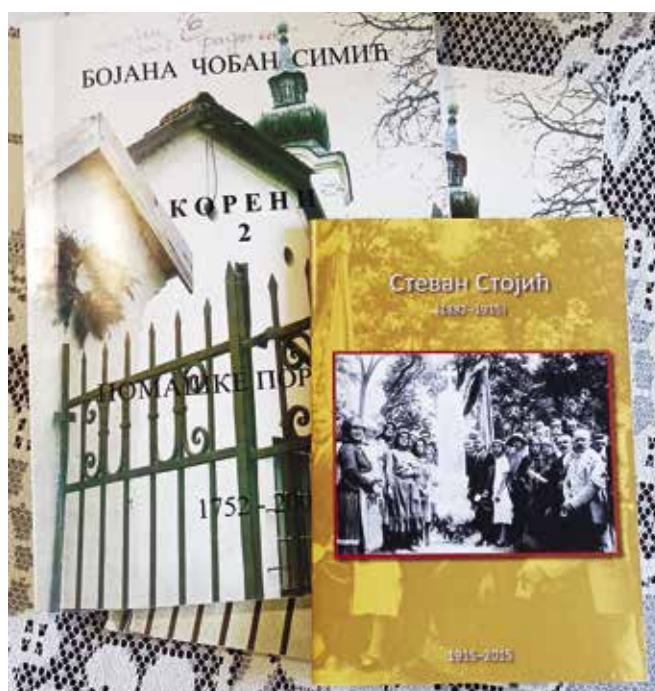
► Sokérvényi kutatómunka eredményeként született helytörténeti kiadványok