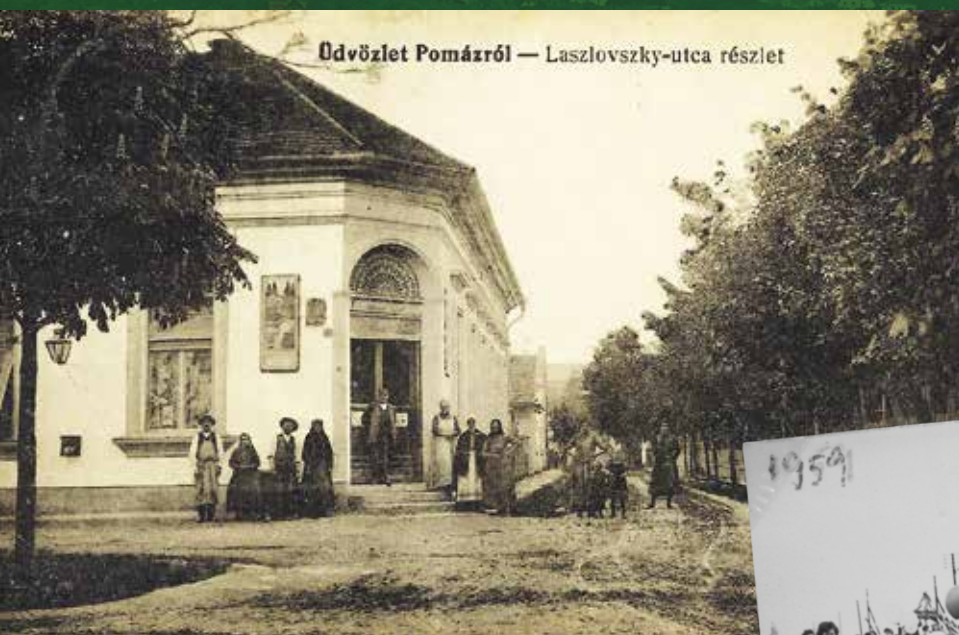
Üdvözlét Pomáztól — Laszlovszky-utca részlet