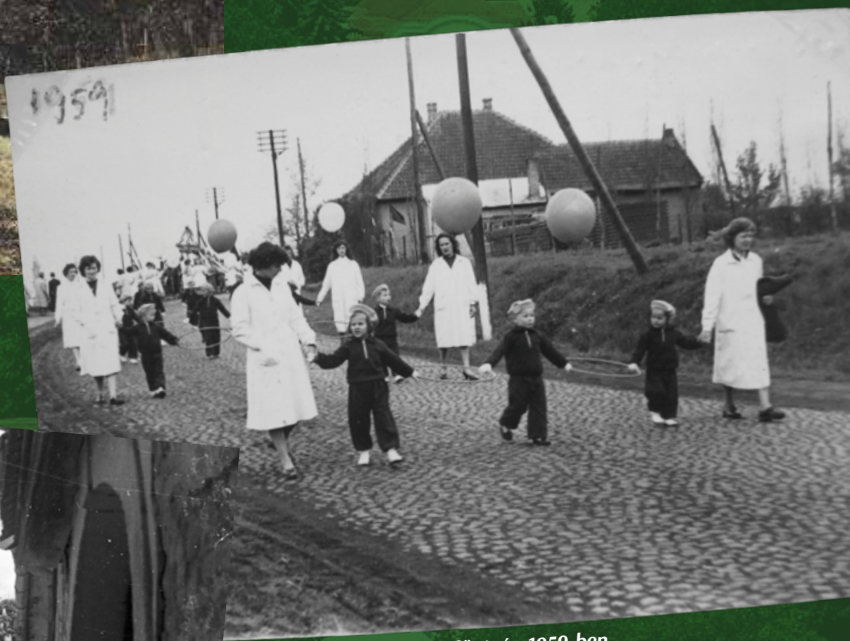
► Óvodások a mai főutcán 1959-ben