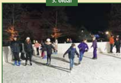
MŰJÉGPÁLVA A SZENT ISTVÁN PARKBAN