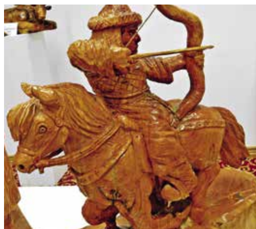
► Lovasíjász – Ádány Lajos alkotása