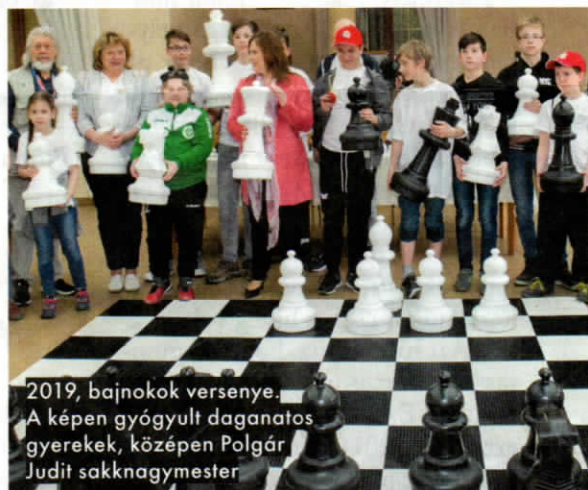
2019. bajnokok versenye. A képen gyógyult daganatos gyerekek, középen Polgár Judit sakknagy mestere

„Mindenütt segítőkész emberekkel találkoztam.”