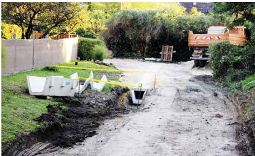
► Az Alma utcában is folytatódtak a Dankó Pista utca környékének csapadékvíz-elvezetési munkálatai

ta utca – Beniczky utca – Bodza utca mentén. A Bodza utcában megakasztotta a munkálatokat, hogy bár voltak előzetes feltárások a környéken, a kivitelezés során kiderült, hogy nagyon hiányosak a közműterképek, nincsenek feltüntetve a vezetett közművek, vagy tévesen szerepelnek rajtuk. A kivitelezők a Bodza utcánál nem tudták elhelyezni a csatornát, mert nem fért be a feltárt víz- és gázvezeték közé.