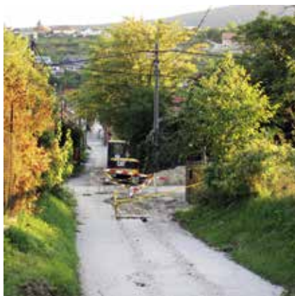
► Dankó Pista utca

Még a nyáron elindultak a Dankó Pista utca és környékének csapadékvíz-elvezetési munkálatai a Középhegy utca – Alma utca – Dankó Pis-