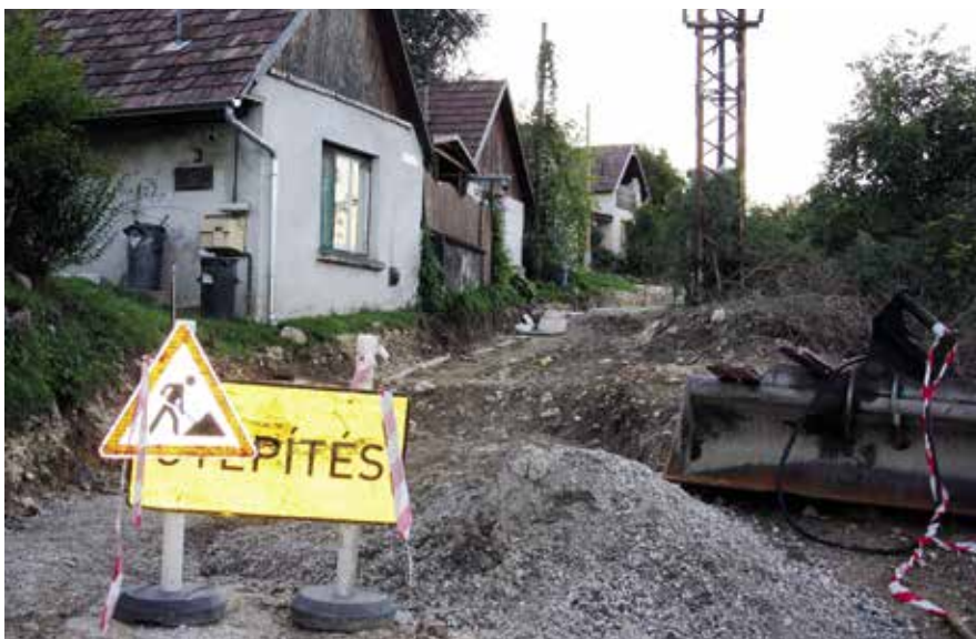
► Vár utca

Megkezdődtek szeptemberben az Alsó, Felső Vár utca és a Vár köz útburkolatának felújítási munkálatai. A kivitelezési munkák részleteiben történnek, hogy a lakók a munkálatok során is közlekedni tudjanak. A tervek szerint a szerződés kötéstől számított 90 napon belül mindkét utca megújul. A beruházás bruttó 41 millió forintból valósul meg.