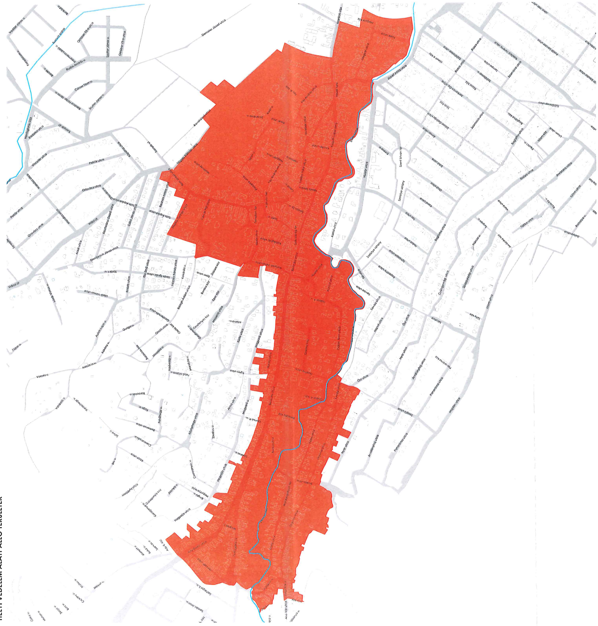
1. MELLÉKLET 1. PONT A ...../2018. (VI. 25.) ÖNKORMÁNYZATI RENDELETHEZ HELYI VÉDELEM ALATT ÁLLÓ TERÜLETEK