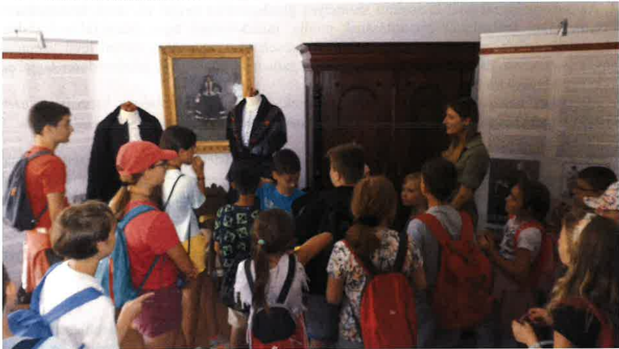
Forrás: Táborozó gyermekek a Pomázi Örökség Tájékozban