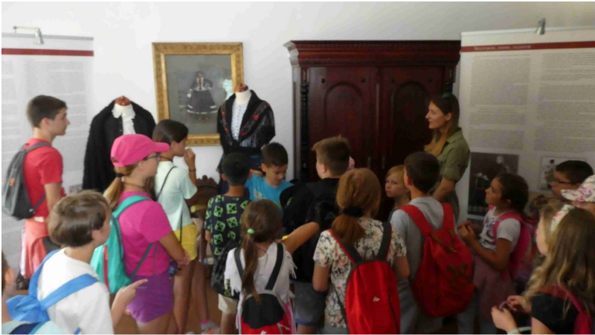
Forrás: Táborozó gyermekek a Pomázi Örökség Tájházban