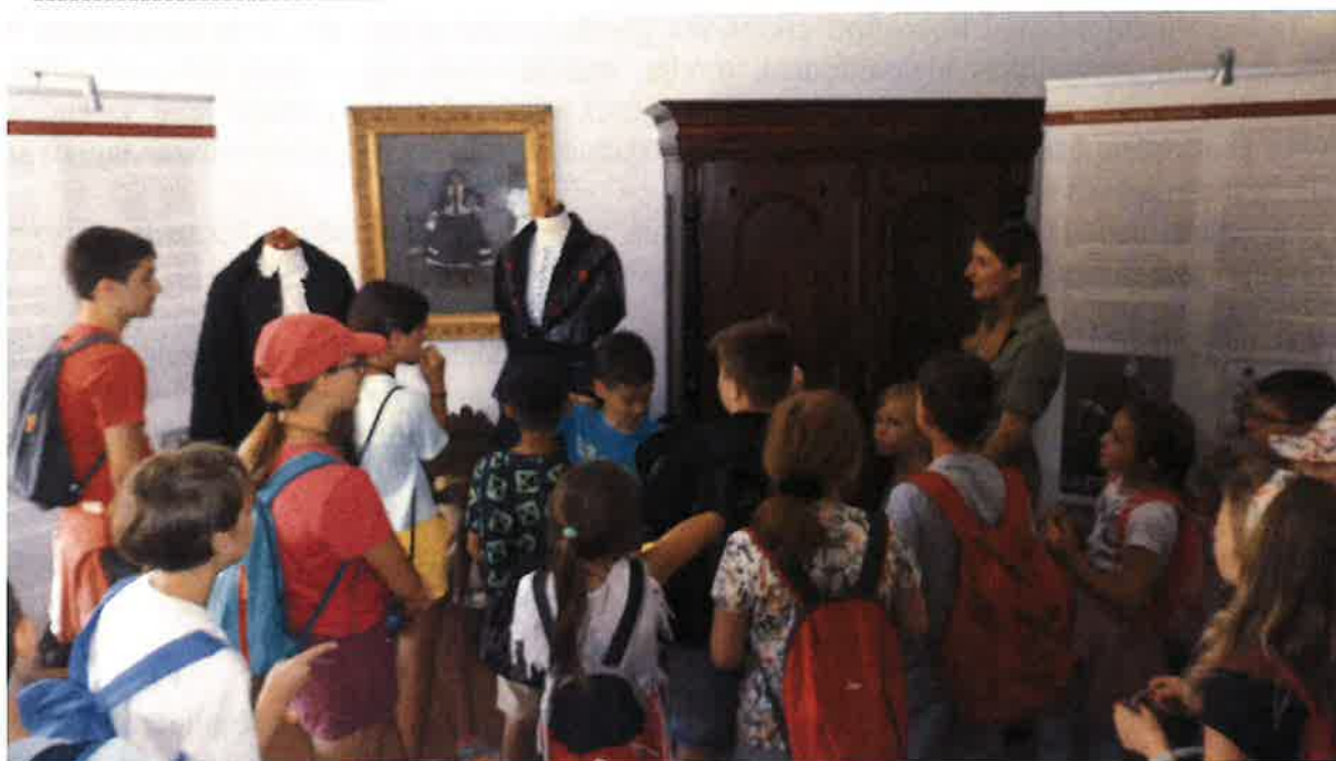
Forrás: Táborozó gyermekek a Pomázi Örökség Tájházaiban