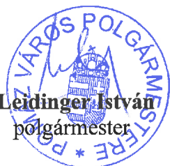
Leidinger István polgármester

Ez a rendelet a kihirdetését követő napon lép hatályba.