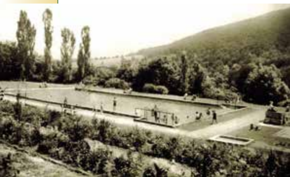
▶ Az azóta lebontott Parádi strandfürdő