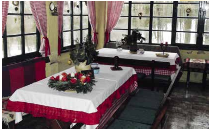
► A felújított Hubertus ház

Sokféle munka és kezdeményezés megtalált. Amikor a Helytörténeti Múzeumot szervezték, akkor megtaláltak, mint villanszerelőt. Édesapámmal és két barátunkkal együtt elmentünk és társadalmi munkában megcsináltuk az egész házban a villanszerelési munkákat, csak az anyagköltséget kértük. A Hősök terén álló Magyar kereszt felújításakor is megtaláltak, hogy tudnék-e segíteni. Szerencsére akkoriban pont egy díszműkovácsnál dolgoztam, és rajta keresztül sikerült elkészíttetni a mécsesstartót. Amikor megcsináltuk a keresztet, a kőfaragó mondott egy összeget, amire mondtuk neki, hogy az sok. Kérdezte, hogy mi mennyiért csináljuk. Semennyiért – válaszoltuk. A végén ő sem kért semmit, csak az anyagköltséget. Azóta minden adventkor mécseset gyűjtünk, feldíszítjük a keresztet és a környékét. Az elmúlt években a Hubertus házat, a volt Janda Vilmos kulcsosházat hoztuk rendbe társadalmi munkában. Kitakarítottuk az épületből az évek alatt felhalmozódott lomot, szemetet, és kívül-belül felújítottuk, berendeztük. Most hasonló a munka a Hősök terénél lévő Civil Háznál is, azt is szinte a semmiből kell felépíteni.