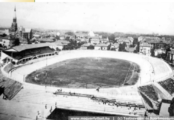
▶ Millenáris sporttelepe