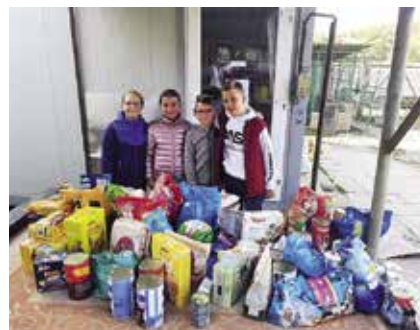
▶ Személyesen vitték el az ajándékot a gyerekek a Pomázi Állatmenhelyre