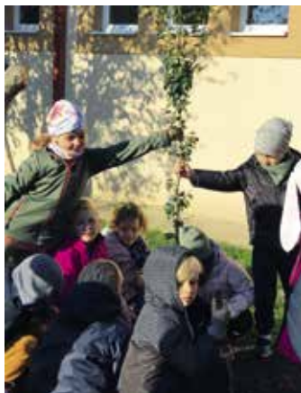
▶ Faültetés a kertben

S míg a nagyok külső helyszínekre kirándultak, addig a kicsikhez házhoz jött a program, a Pomázi Művelődési Ház és Könyvtár szervezésében bábelőadást élvezhettek az alsós diákok a tornacsarnokban.