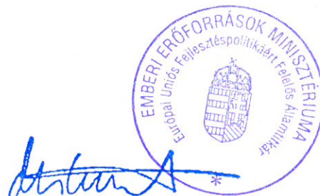
Vitalyos Eszter európai uniós fejlesztéspolitikáért felelős államtitkár