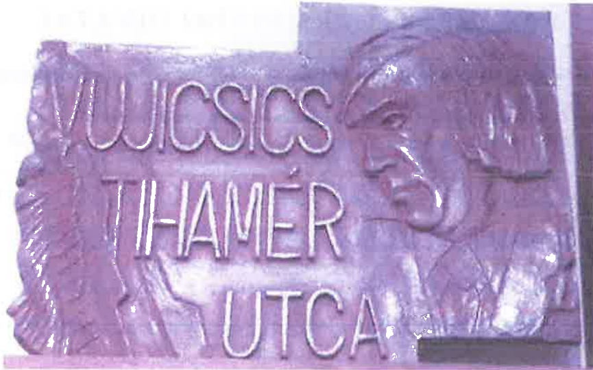
Ócsai Károly által készített utcanév tábla Vujicsics Tihamerról

Pomázon a Bem József – Lupa Vidor – Szerb utca – Vujicsics tér és a Templom tér találkozásánál található a Budai Szerb Ortodox Egyházmegye temploma (585 hrsz.). Az ingatlanon a Templom tér felé eső lakóépület homlokzatára kerülhetne kihelyezésére a névtábla, az 599 és az 585 helyrajzi számú ingatlanok közös szakaszán, annak nyugati részén. A templom a földhivatali ingatlan-nyilvántartás alapján a Szerb utca 8. szám alatt található, így címváltoztatás egyik ingatlant sem érintene.