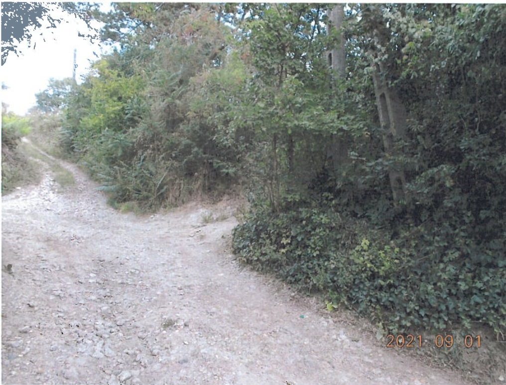
A fotó Cseresznyés utca felső szakaszának végén a Szilva utca nem hivatalos becsatlakozásánál készült.

Kérem a Tisztelt Képviselő-testületet, hogy az [REDACTED] személygépjármű gumiabroncs sérülésével kapcsolatos kártérítési igény tárgyban döntést hozni szíveskedjen.