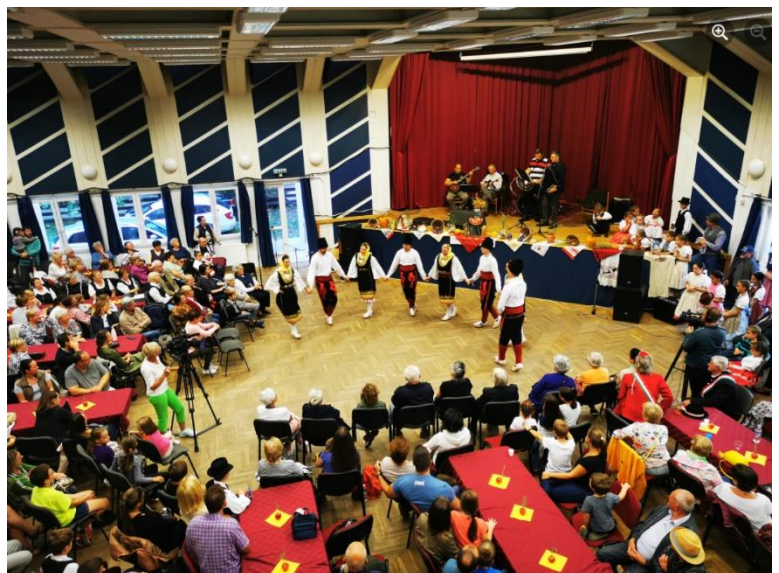
Fotó: Kovácsics Mária és Tóth Gábor