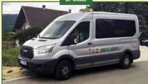
KISBUSSZAL A VÁROSBAN