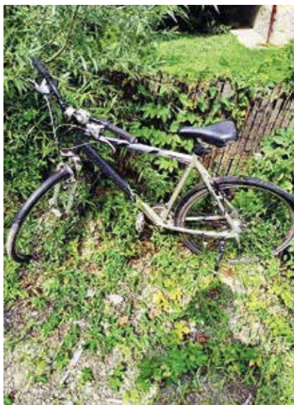
► Bokorba rejtett bicikli

A két szolgálatban lévő közterület-felügyelő elmondta, hogy amikor a helyszínre érkeztek, már nem találták ott a fiatalokat, akik gyalogosan hagyták el a területet. A környéken nem találták őket, de a szabadnapját