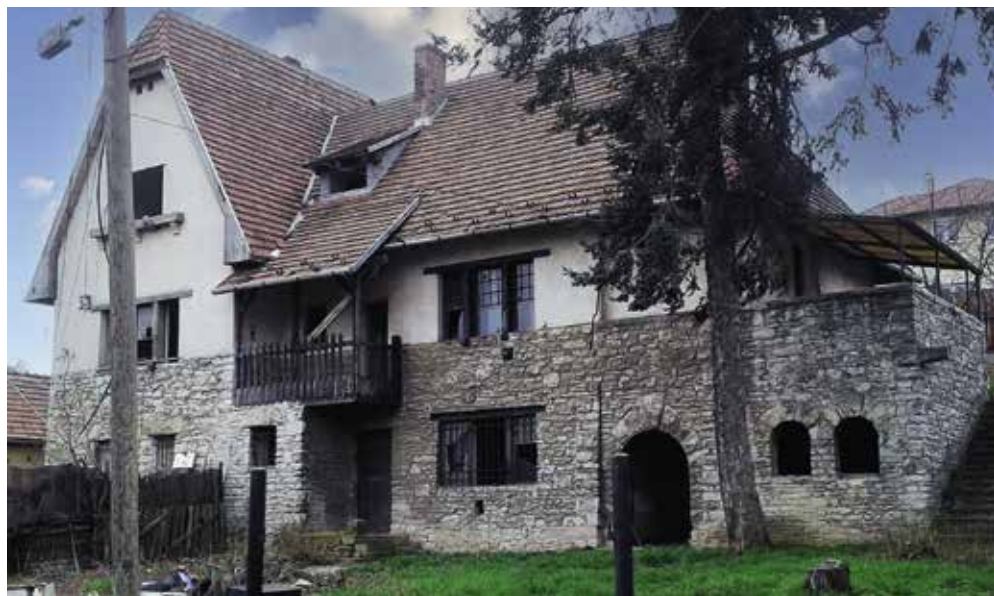
► Az Orgona utcában álló Marschalkó villa