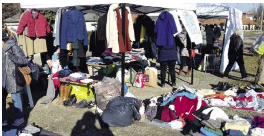
► Ruhabörze a rászorulóknak

Tapasztalatot szereztem, hogy milyen területen lehet segíteni a rászorultakon. Felmérve a pomázi helyzetet, azt láttam, hogy van adományozó, van rászorult, csak nem találkozik a két alany. Ennek az igénynek tetünk eleget, amikor megcsináltuk a Szent István Téri Akciócsoporttal (SZITA) a ruhabörzét. A lakosságtól begyűjtöttük a felesleges ruhafélét, aztán lehetőséget biztosítottunk arra, hogy akinek szüksége van, az jöjjön, vigye. Ebből aztán folytatódott, hogy bútort, berendezési tárgyakat is közvetítettünk, sok ember örömére. Alakítottam egy „Pomázi in-