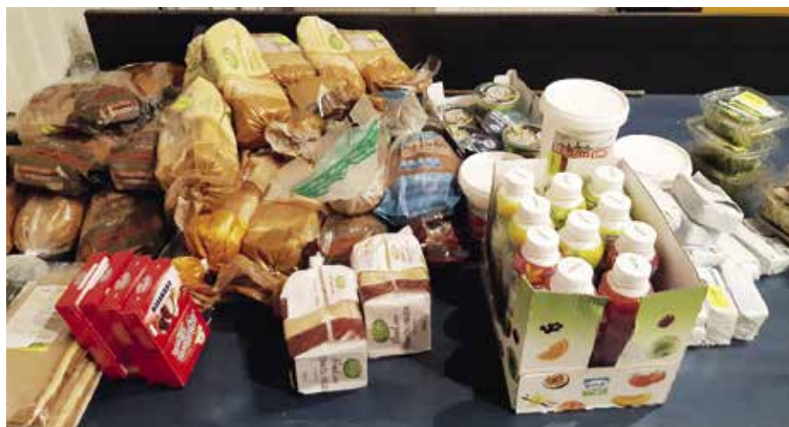
► Ételosztás minden kedd és szerda este van

gyen adom” csoportot, ahol a mai napig megy a kért és felkínált dolgok gazdakeresése.