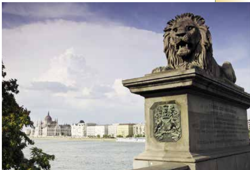
► A Lánchíd oroszlánja

Az önkormányzat megbízásából ebben az évben a PANNON PROTECT Kft. elvégezte a Marschalkó villa tetőszerkezetének felújítását. Ennek keretében megcsinálták a tetőt, a cserepezést, az új ereszcatornákat, hogy az esővíz ne az épületre folyjon, emellett a faanyagvédelmet gomba-, rovar- és tűzkár ellen is. A nyílászárókat OSB lemezekkel takarták be. A civilek segítségével megtisztították az ingatlan kertjét.