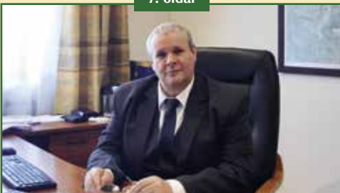
INTERJÚ A POLGÁRMESTERREL