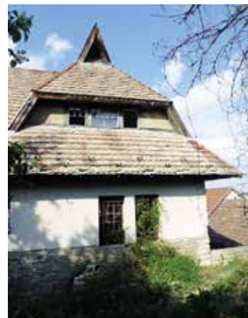
► Az épület oldalnézetből