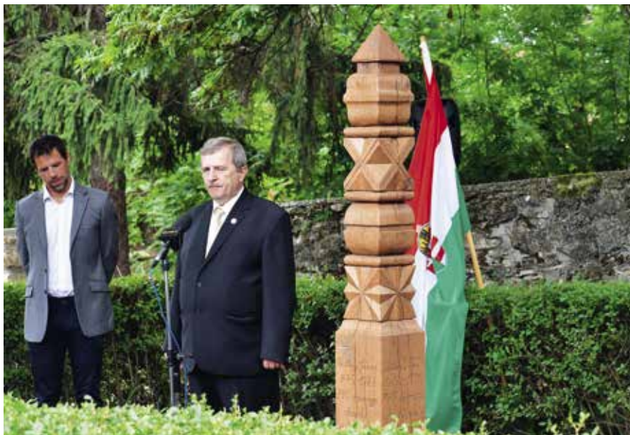
► A Teleki-Wattay kastély parkjában felállított kopjafa