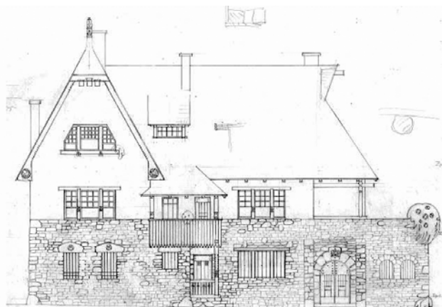
► A villa, ahogy megálmodták – utcai homlokzat

Az önkormányzat megbízásából ebben az évben a PANNON PROTECT Kft. elvégezte a Marschalkó villa tetőszerkezetének felújítását. Ennek keretében megcsinálták a tetőt, a cserepezést, az új ereszcatornákat, hogy az esővíz ne az épületre folyjon, emellett a faanyagvédelmet gomba-, rovar- és tűzkár ellen is. A nyílászárókat OSB lemezekkel takarták be. A civilek segítségével megtisztították az ingatlan kertjét.