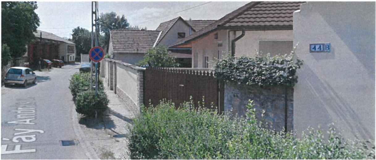
2. ábra: Fáy András u. megállni tilos tábla helye a forgalomszervezési felülvizsgálat szerint (2013-as fénykép)

A 2. ábrán látható felvételi az online térkép alapján 2013. évben készült, ekkor a tábla még a felülvizsgálatnak megfelelő helyen volt. A 3. ábrán látható kép szemlélteti, hogy a tábla A Fáy András u. 42-44/A számú ingatlanok előtt található, a kép 2021.08.05-én készült. A 4. ábránál látható képen pedig látható, hogy ahol a táblának lennie kellene a felülvizsgálat alapján, ott csak a tábla nélküli üres oszlop található. A kialakult helyzet tisztázásra szorul, így javasolt a tábla eredeti helyére történő visszaállítása.