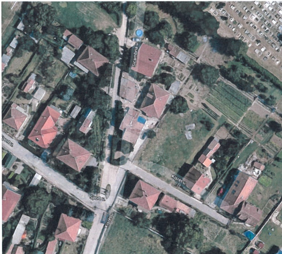
1. ábra: Kistrét – Sicambria u. kereszteződése

A meglévő tábla áthelyezésével, valamint még egy zsákutca tábla kihelyezésével a kialakult helyzet megoldható lenne, továbbá a táblák kihelyezése is szabályossá válna.