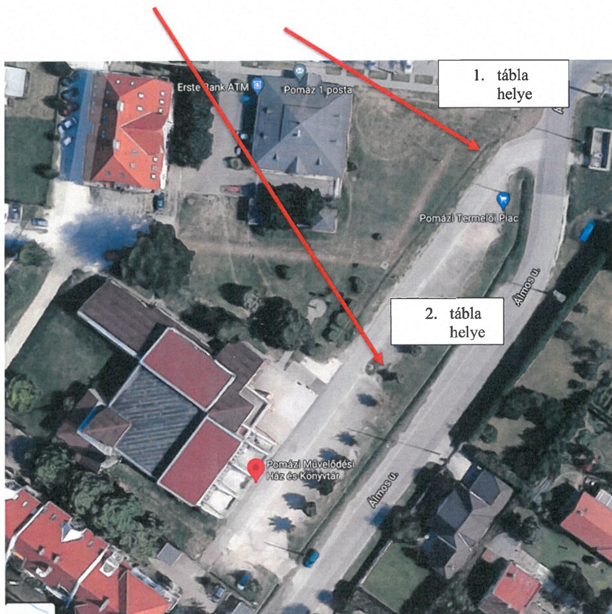
9. ábra: Pomáz, Művelődési ház területe

2. tábla: mindkét irányból behajtani tilos tábla kihelyezése kiegészítő táblákkal („Szombaton 06:00-13:00”; „Kivéve engedéllyel”)