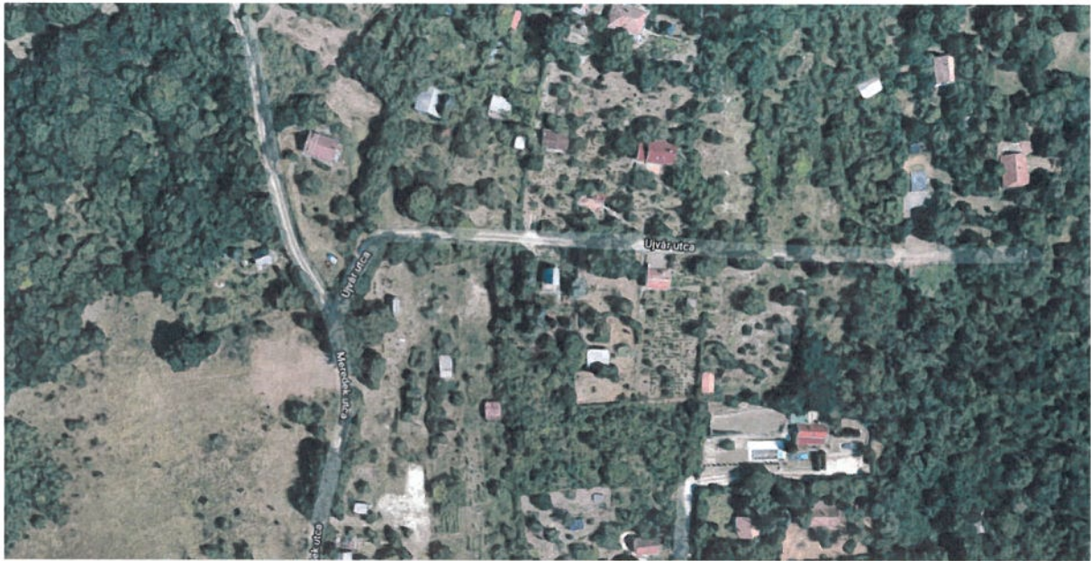
6. ábra: Kőhegy-Kráter utcák kereszteződése

Az online térképeken még Meredek és Újvár utca szerepel, azonban a pomázi utcanévjegyzékben ezek már Kőhegy és Kráter utcaként szerepelnek. A térképrészleten is látható, hogy a Kráter utcának nincsen folytatása, így a Kőhegy és Kráter utca kereszteződésébe is javasolt a zsákutca tábla kihelyezése.