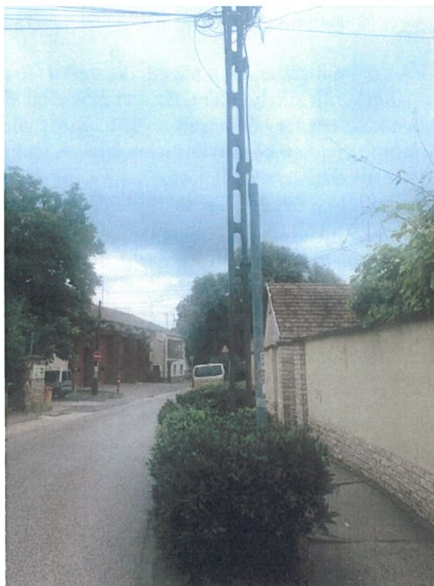
4. ábra: Fáy András u. 44-46. számú ingatlanok előtti üres oszlop