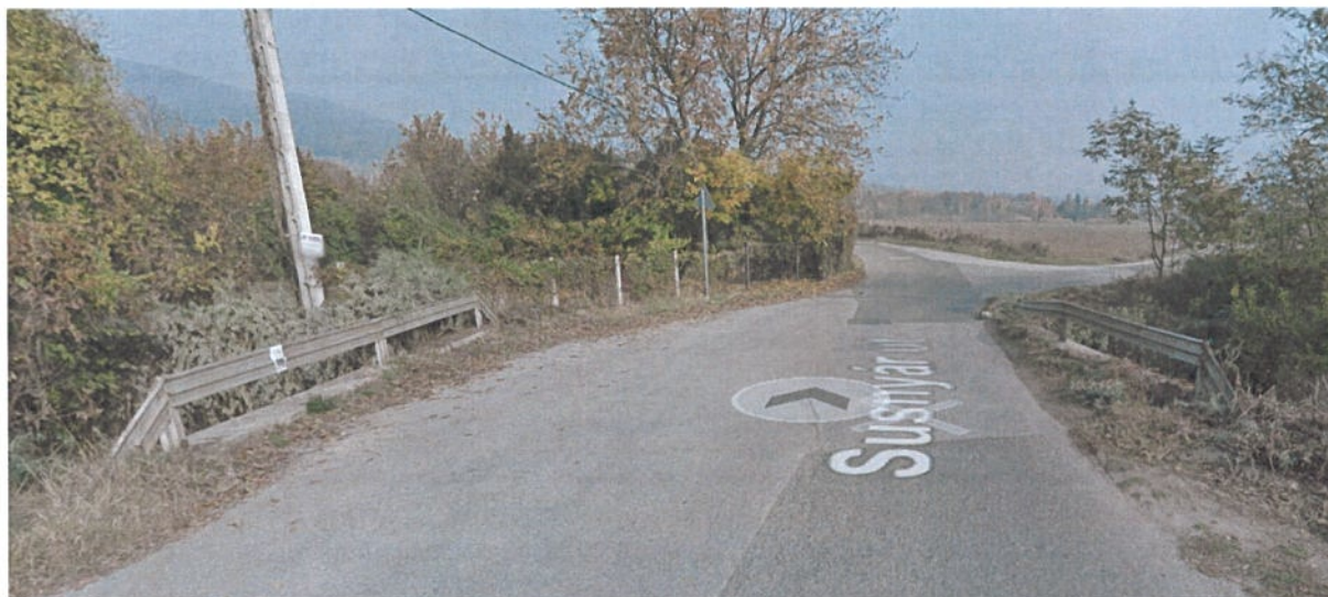
8. ábra: Susnyár utcai kishíd

A tábla nem tartozik a közlekedési táblák közé, így annak kihelyezése tulajdonosi és közútkezelői hozzájárulással is kihelyezhető.