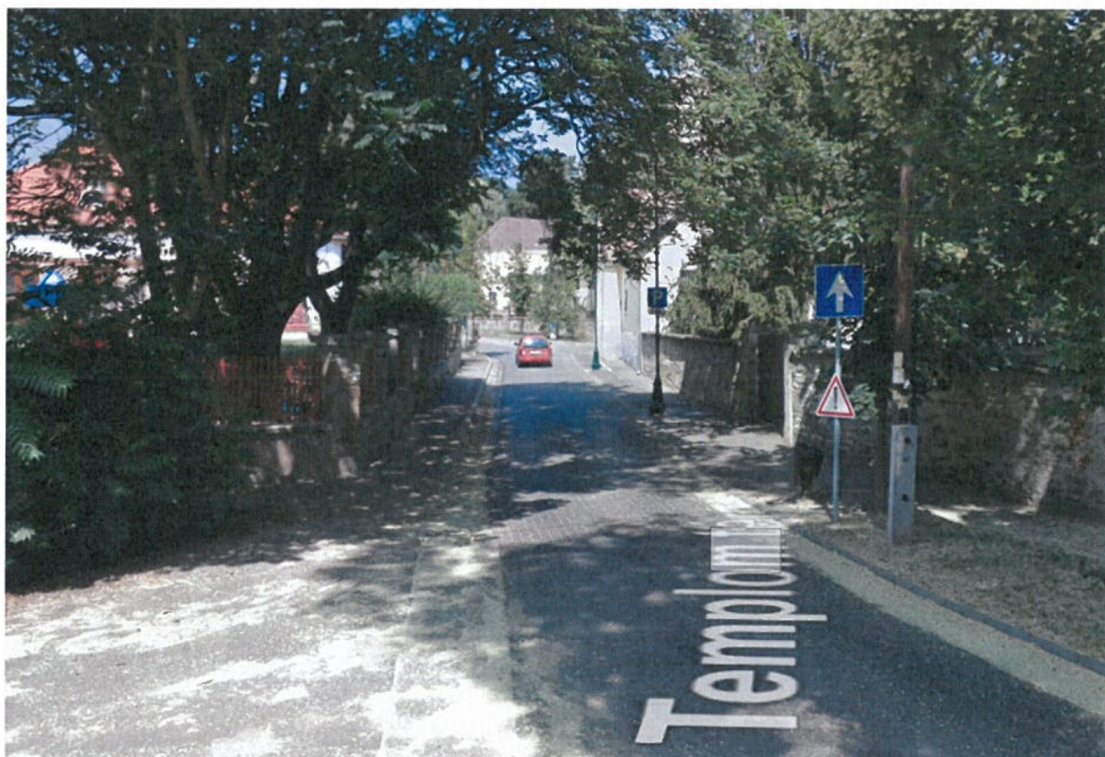
7. ábra: Templom tér 11. előtti közterület

A parkoló tábla alá egy újabb kiegészítő táblát lehetne kihelyezni: „H-P 8:00-15:00 a bölcsőde intézmény dolgozói”. Ezzel Pomáz Város Önkormányzata biztosítani tudná a parkolást munkaidőben az ott dolgozók részére. A bölcsőde dolgozóinak valamilyen okiratot, kártyát kellene a szélvédő mögé kihelyezni, amely lehetővé teszi a gépjárművek jogszerű várakozásának ellenőrzését.