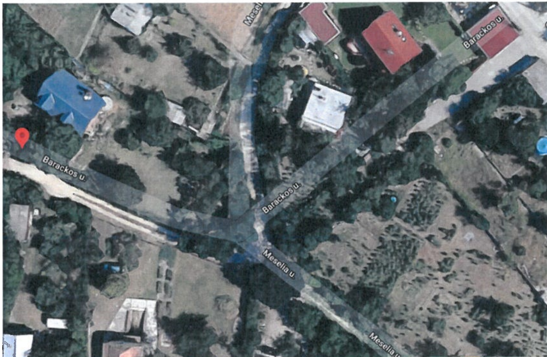
5. ábra: Barackos -Messelia u. kereszteződése

A Messelia utca felől a Barackos utca felé haladva nincsenek kint zsákutcát jelző táblák. Az online térképeken úgy látszik, hogy a Barackos utca a Füge utcán keresztül összeköttetésben van a Felsőhegy utcával, de ez a gyakorlatban nem így van. A Füge utca felső szakaszának kiépítéséig az ott lakók biztonsága és nyugalma érdekében indokolt lehet a zsákutca tábla a kihelyezése a Messelia utca Barackos utca kereszteződéséhez.