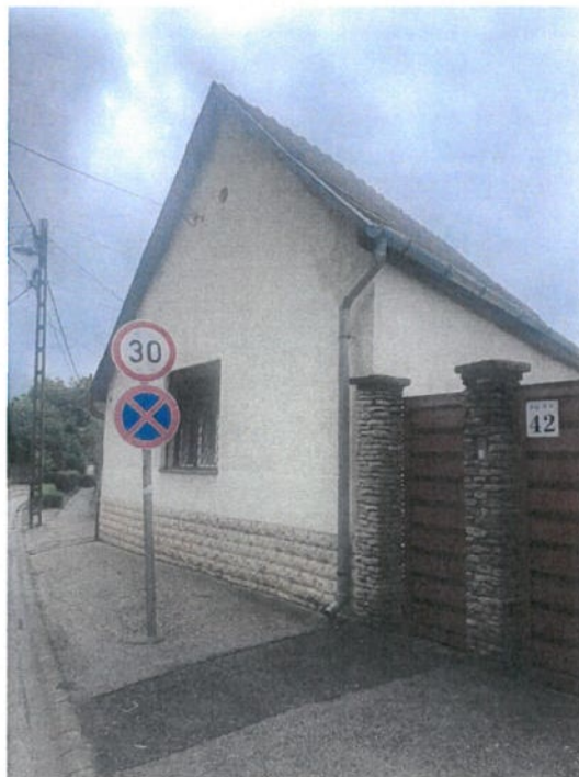
3. ábra: Fáy András u. 42-44/A számú ingatlanok előtti megállni tilos tábla (2021.08.05-én készült kép)