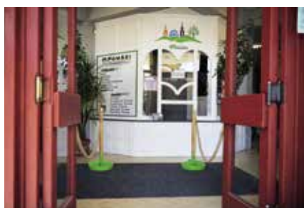
► Az információs pult is megújult