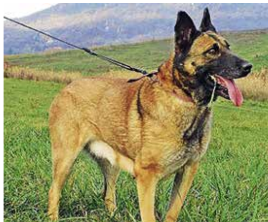
► Glória is gazdára vár a pomázi menhelyen

POMÁZI ÁLLATVÉDŐ ÉS ÁLLATSEGÍTŐ EGYESÜLET MENHELVE