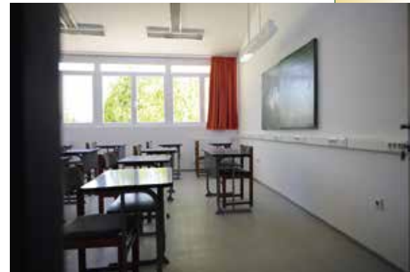
► Okosító terem