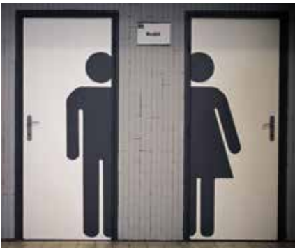
► Egymást kiegészítő pár a mosdók ajtaján

fotópályázatra érkezett, Pomázi-ról készült fényképek díszítik, hogy a látogatók igazán magukénak érezhessék az intézményt.