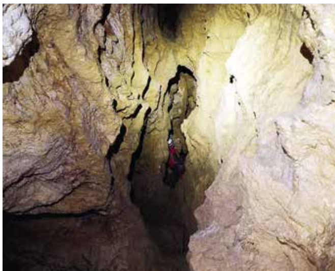
► A Pomázi kőfejtő Felső-barlangja

A védett természeti környezet részét képezik a barlangok. Magyarországon minden barlang védett, még az is, amit esetleg nem fedeztek fel. De mi számít barlangnak? Minden, a Föld szilárd kérgében természetes úton keletkezett, ember számára járható méretű üreg, amely legalább 2 méter hosszú.