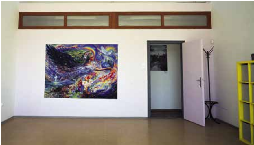
► Harmónia terem