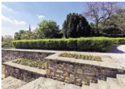
► Kertészeti iskola tanárai és diákjai segítségével szépült meg a kastély parkja

Kedves egészség- és felebarátaink, jó és leendő ismerőseink. Talán lassan egy megszokottabb kerékvágásba lendül az életünk. Semmi nem lesz már a régi, de próbáljunk, egymásra és magunkra vigyázva, újból élni. A kastély is szeretne végre felébredni Csipkerózsika álmából. Ismét várjuk kedves vendégeinket, akár hosszabb időre, akár csak egy röpké látogatásra. Ezt erősítendő nekiláttunk a park szépítésének, amelyben a Magyar Gyula Kertészeti iskola tanárai és diákjai vannak segítségünkre. A tavaly elkezdett kulturális programokat is szeretnénk folytatni. Június hónapban is több érdekesnek és élvezetesnek ígérkező programot kínálunk az érdeklődők és művészetpártolók számára.