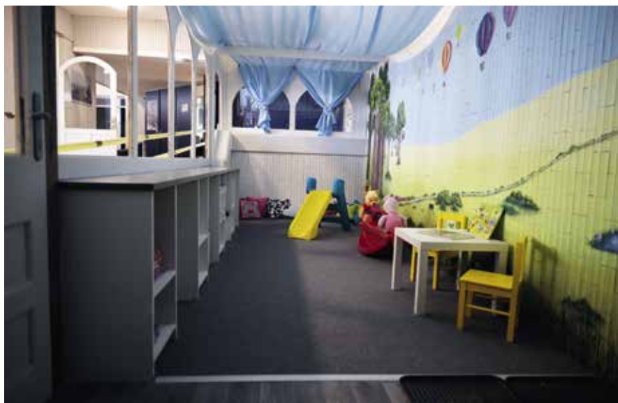
► Gyerekbirodalom a földszinten

Az idén 40 éves intézmény belső terei nagy változáson mentek keresztül, ami már a bejáratnál feltűnik. Az előtérben ugyanis nem a régen megszokott barna csempés falak fogadják a látogatókat. Azokat világosszürkére festették, így a tér jóval nagyobb, barátságosabbnak tűnik. A földszinten további újdonságok is fogadják a vendégeket. A korábban ruhatárként, majd raktárként üzemelő részből az intézmény munkatársai