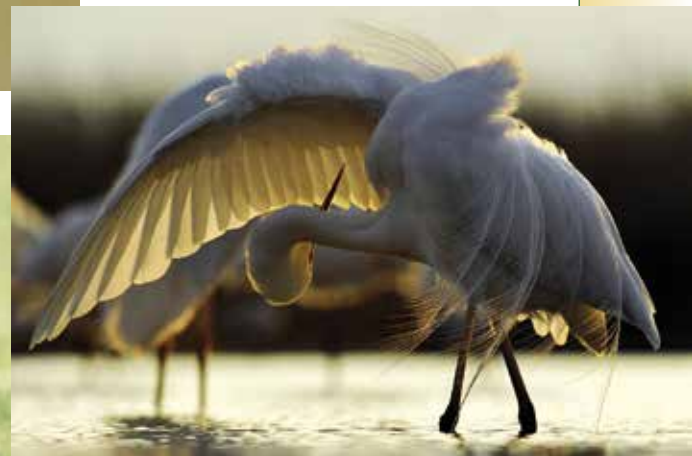
► Tollászkodó nagy kócsag