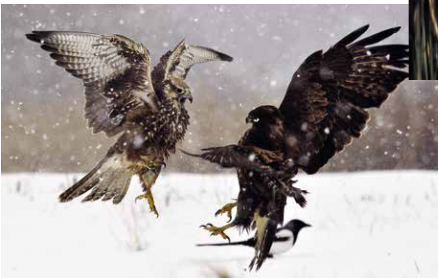
► Kerecsensólyom és egerész ölyv csatája