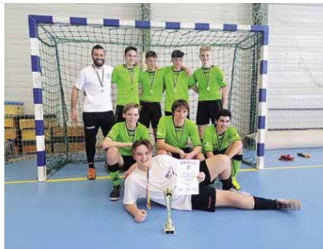
► Az U17-es csapat első helyezést ért el a Futsal versenyen

A tavasz érkezésével a szabadtéri mérkőzésekre helyeződött a hangsúly, mivel a Pest megyei bajnokságban 4 különböző korcsoportú csapatunk is szerepel. Sajnos a jogszabályok miatt ezeket a mérkőzéseket zárt kapuk mellett kellett megrendezni a szülők és szurkolók nagy bánatára.