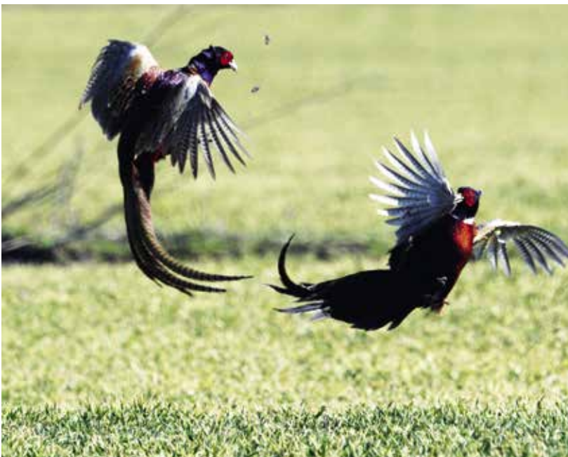
► Fácánok harca