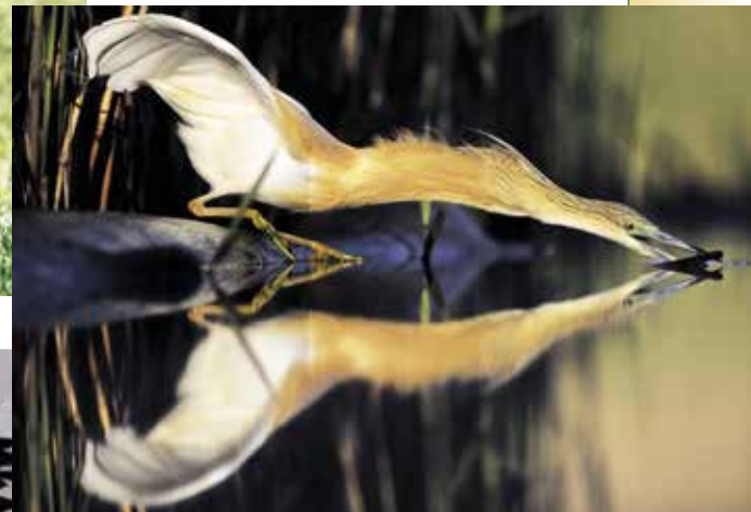
► Vadászó selyemgém