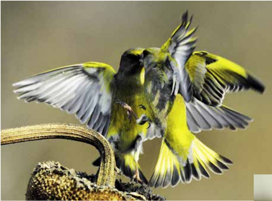
► Zöldikék Pomáz határában

őzetetőt, amibe, ha bebújok, akkor onnan szép képeket tudok csinálni. Hajnalban megjelentem, és kértem, hogy vigyen be a terepjárójával, de ő ezt nem akarta. Kitaláltam, hogy felteszem a Wartburgomra a hóláncot, és így megyek be a területre. Annyi jótanácsot még kaptam, hogy ha elakadnék, akkor azt a bejáratnál tegyem, mert ott van egy istálló, és a lóval ki tudnak húzni. Mire beértem, az egész kocsi sáros volt, ahogy a lánc felcsapta azt a kocsira, de nem akadtam el. Így hajnalban bebújtam a roskatag őzetetőbe, kivártam a delet, amikor – ahogy mondta a meteorológia – elállt az eső és kisütött a nap. Ahogy elállt az eső tényleg jöttek a tűzokok, és nagyon szép képeket lehetett csinálni. Sok dolgot be kell vállalnia az embernek a szép képekért.