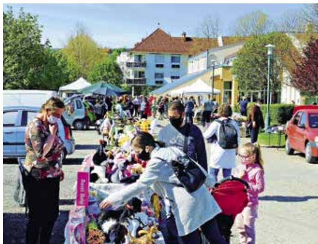
► Pomázi Piaci Bazár május elsején