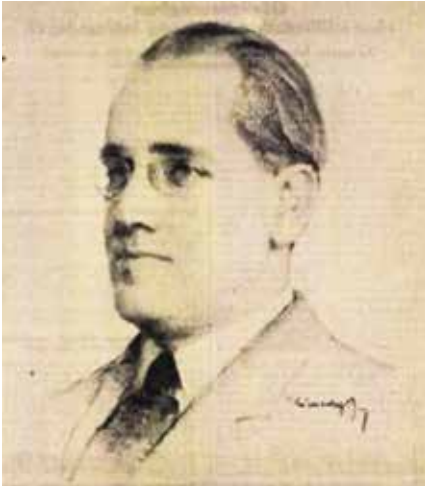
► Kövesdy Géza festőművész szénrajza Radnai Miklósról 1935.

Élete utolsó három évében tavasztól őszig Pomázon töltötte idejét Radnai Miklós az Operaház igazgatója, zeneszerző, zenekritikus. Őt és családját is elvarázsolta a település és az azt körülvevő természeti környezet szépsége. Otthonukat, és így Pomázt is a kor több híressége is rendszeresen látogatta.