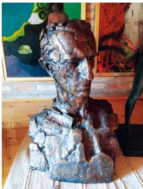
▶ Zoran Ivanovic Nikola Teslát ábrázoló szobra

Térítésmentesen biztosítja a Beniczky utca 2. szám alatti önkormányzati helyiségben a Kevély Táncegyüttes fellépő ruháinak tárolását az önkormányzat.