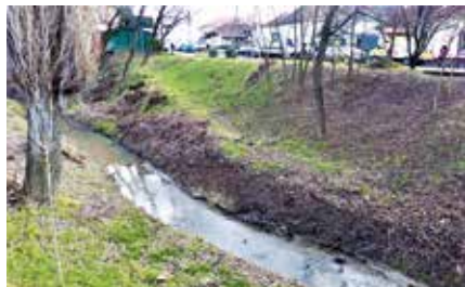
► A keleti rámpa nyomai

A Dera-pataknak az 1. sz Óvoda előtti híd és a Csikóvár üzletház közötti szakaszán még látható nyoma van egy le- és felvezető rámpának. Mire szolgált vajon ez a két rámpa?