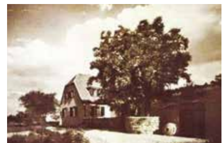
► Radnai villa (Papmalom)