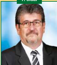
RÉDEI IMRE INTERJÚ