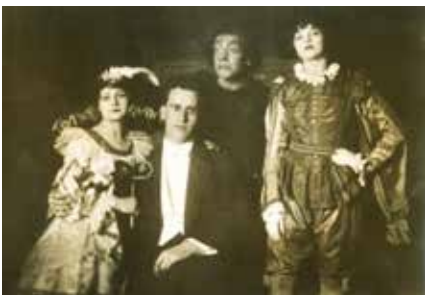
► Az infánsnő születésnapja – premier a főszereplőkkel