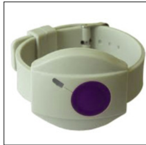
A képek illusztrációk

A segélyhívó riasztó készülék nyakbaakasztható riasztó-készülék/vagy karóra jellegű lesz. A készülék GSM hálózatot (mobil hálózat) használ a vészjelzés indítására esetleges rosszullet vagy baleset esetén, amikor a telefon készülék fizikai elérése nem megoldható. A jelzőkészületről indított segélyhívás során két irányú beszédkapcsolat jön létre az ellátott és a diszpécser (telefonközpont) között. A diszpécser hívja az ügyeletes kollégánót, aki azonnal indul a helyszínre segítséget nyújtani. A segélyhívó rendszer a nap 24 órájában működik.