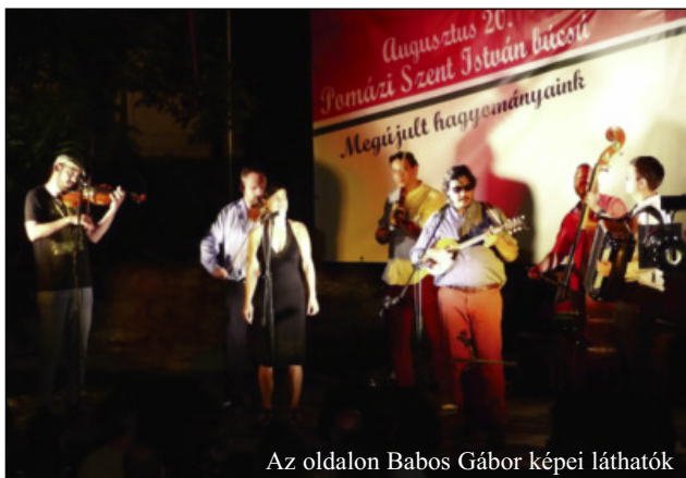
Az oldalon Babos Gábor képei láthatók