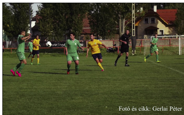
Fotó és cikk: Gerlai Péter

A haziaiknál Dankovics, Lukács és Dalkó 2-2, Faragó és Kuczmoz 1-1 góllal járultak hozzá a győzelemhez, míg a pomáziak közül Gyurkovics, Kovásznai, Sörgő és Rudolf góljai enyhítették a vereség nagyságát.