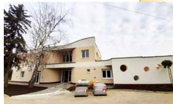
► Az elkészült új bölcsőde épülete

A napokban fejeződött be az a nagy munka, ami a 2021-27-es európai uniós költségvetési ciklus településfejlesztési javaslatait foglalja össze. A munkatársakkal 138 projekt tervlapot töltöttünk fel, ez egy nagyon nagyszabású fejlesztés. Vannak benne kisebb, néhány 10 milliós, több 10 milliós és több milliárdos fejlesztések is. Többek között városfejlesztési és -rehabilitációs tervek, a szegregált területek fejlesztése, sziklaszínház, kulturális- és az ifjúságnak szánt területek fejlesztése. Közben dolgozunk a MÁV-HÉV és a Budapesti Fejlesztési Központ összefogásában épülő HÉV fejlesztési projektben. Komplet javaslatot tettünk le az asztalra, hogy mit kellene csinálni az 1112-es úttal, hogy a Pomázon állandósuló dugók megszűnjene. Próbáljuk tovább vinni ezt az elképzelésünket a Budapesti Fejlesztési Központ irányába. Közben igyekszünk a pomáziak érdekeit képviselni a Nemzeti Infrastruktúra Fejlesztőnél a budakalászi fél-elkerülő út