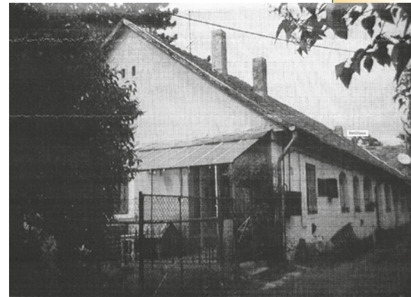
► Fáy kúria (átépítve) – A világotutazó asszony pomázi szülőháza

Az észak-amerikai utazása során látottakat hasonló stílusban eleveníti fel. Mindenről aprólékosan, nagy igényességgel tájékoztatja a Kárpát-medence olvasóit, akik előtt egy teljesen új világot nyit meg. Transzkontinentális vasúton való utazás, hatalmas méretű és pazarul berendezett szállodák, teljesen más növényzet és éghajlati viszonyok, liberális elveken működő társadalom és annak történelme, a tengerpart nyüzsgése, az ország emlékhelyei, templomai stb. Világkörüli tervezett útján csak Mexikóig jutott el, s ekkor járta be Kuba szigetét is. Nagy, képes könyvben és újságcikkekben is beszámolt ezekről az akkor már 60 éves nő.