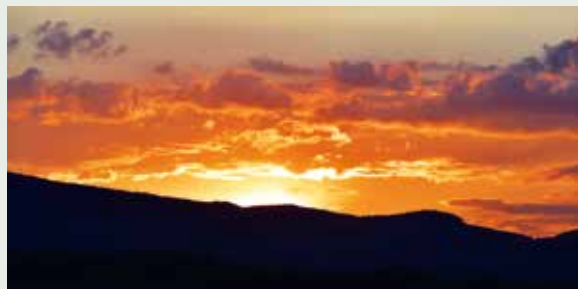
► A Nap búcsúja...

„A fényes Nap immár elnyugodott, A föld színe sötétben maradt, Nappali fény éjjelre változott, Fáradtaknak nyugalomhoz hozott.