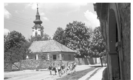
► Gyerekek a Luppá Vidor utcában az 1950-es években

Nélkülük ez a könyv nem lenne teljes. És mi ragaszkodunk minden egyes csepphez, minden pillanathoz...! A csillagos éghez! Névtelen csillagok: részek az egészhez!