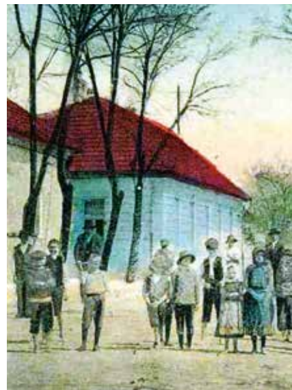
► A Mocsáry család villája a mai Beniczky utca-Hunyadi János utca sarkán

Részben gyerekkori álmait valósította meg, amikor Indiába és Ceylonba hajózott. Naplójában, haza írt leveleiben nem csak a helyeket és útitársait írta le: a szokásokról, a közlekedésről, műemlékekről, szállodákról is pontos feljegyzéseket készített. A társadal-