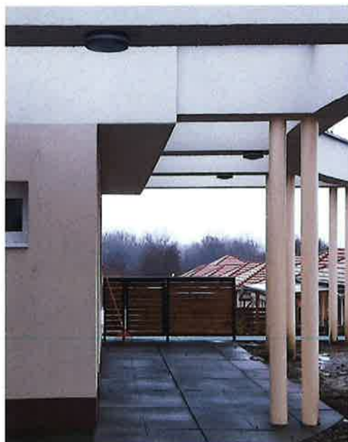
Pomázi új bölcsődéhez már beépített kapu!