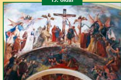
250 ÉVES A SZENT ISTVÁN KIRÁLY PLÉBÁNIATEMPLOM