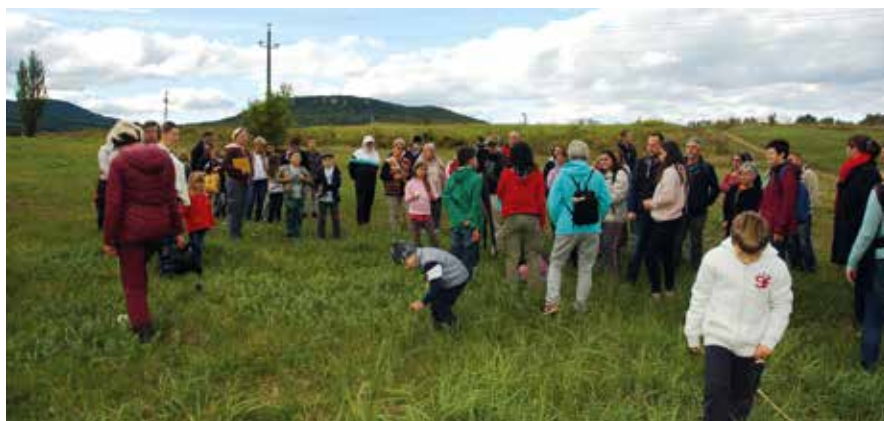
► Séta a Kliszára tervezett tanösvényen

line is elérhető. Wass Albert regényének A furtinelli boszorkány filmváltozatát pedig a művelődési házban vetítették.