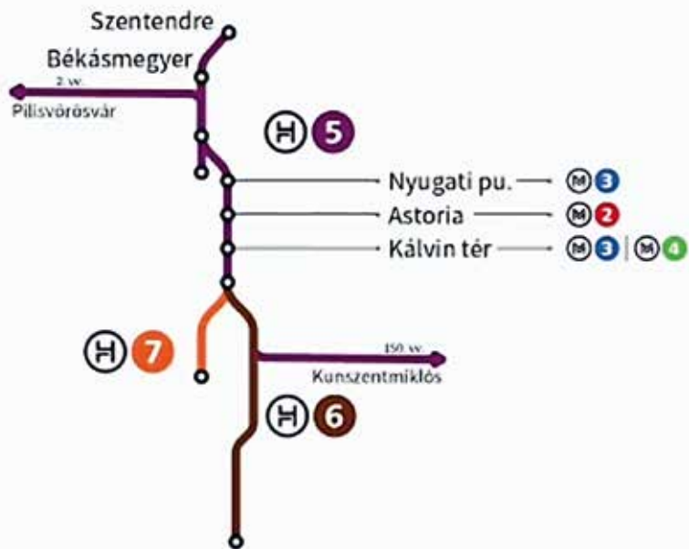
► 5-ös metró koncepciója: az Észak-Déli HÉV vonalak összekötése

A korábbi, 2008-as gyorsvasút fejlesztési tervekben is szerepelt egy kikerülő szakasz, ennek a 1112. számú főútra való visszakötésre a közeljövőben megvalósuló ipartelepi körcsomópont is alkalmasnak látszik (NIF Zrt. - ProUrbe Kft.).