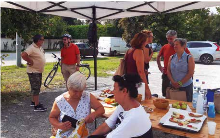
► Képviselői reggeli a művelődési ház előtti piacon

• Vadkamerákat szerzett be és helyezett ki az önkormányzat, az illegális hulladék lerakatok hatékonyabb felszámolása érdekében.