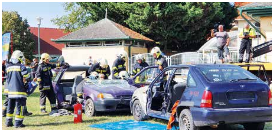
► Baleseti mentést mutatnak be a tűzoltók

A koronavírus-járvány miatti szigorítások és megelőző intézkedések meghatározták a városossá avatás 20 éves évfordulójára készülő ünnepséget. Az önkormányzat ugyanis úgy döntött, hogy nem mondja le a Pomáz napot, hanem egy héten át, több helyszínen, több kisebb rendezvényt tartanak, amiken nem vehet részt egyszerre 500 főnél több ember.