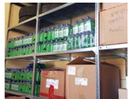
► 30 millió forintot költött az önkormányzat a járvány miatti veszélyhelyzetben

• A korábbi gyakorlatot felváltva az SZSZK Család- és Gyermekegészségügyi Szolgálat állítja össze az ételmisszerostásra valóban rászorultak listáját. Az ételmisszerostást önkéntesek végzik.