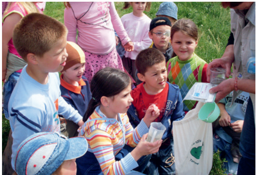
► Vízvizsgálat Gyulán 2009-ben

ti és pedagógiai konferenciával, és emlékfá ültetéssel ünnepeltük meg. Nagy elismerés számunkra, hogy a Nemzeti Múzeumban nyílt „A mi időnk '89-'90” című kiállításon a történelmi események bemutatása mellett (pl. Nagy Imre újratemetése, a vasfüggöny átvágása stb.) a Zöld Szív relikviái is helyet kaptak.