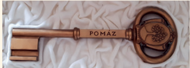
► Pomáz város kulcsa

Belépés díjmentes, de regisztrációhoz kötött a létszámkorlát miatt. Regisztráció: az msz.pomaz@gmail.com címen vagy a 20/350-9721-es telefonszámon