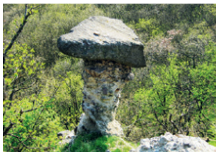
► Napóleon kalapja a Kő-hegyen

Ha már a Pilisről beszélünk, akkor azt is illene tudni, hogy a földrajzosok a Pilis alatt csak a Derától nyugatra eső területet értik, míg mi egyszerű átlagemberek a történelmi Pilist, azaz a Pilis Visegrádi-hegységet, mint egészet. Számunkra természetes, hogy a Holdvilág-árok a Pilisben és nem a Visegrádi-hegységben található. Pedig a kettő között jelentős a különbség. A Pilis hegység