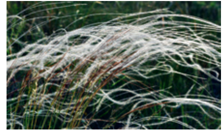
► Árvalányhaj is nő a környező réteken

a befagyott jegén, míg csapadékosabb nyaraikon akár csónakázni is lehetett rajta. Fokozottan védett környék.