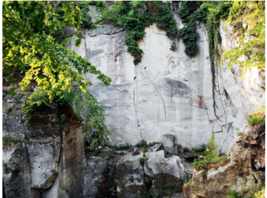
► Holdvilág-árok nagy sziklafala

ekkoriban még magas és vastag falromok álltak, többször végzett kutatásokat. A feltárások során az itt talált romokat középkori királynéi vár nyomaiként azonosította, ame-