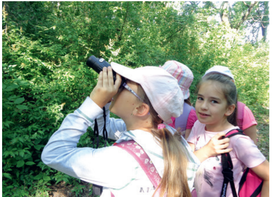
► Dunaharaszti a zöldszíves tanösvény bejárása

Sikeres projektjeink évek óta működnek. Vízvizsgálatainkat negyedévenként végezzük. Patak, mező és erdő projektjeinket munkafüzetek és eszközsákok is segítik, és