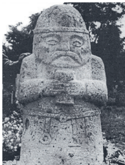
► Kunbaba, a Pilis kutatójának sírján (Forrás: Holdvilágárok – Holtvilágárok című könyv)

Legismertebb kutatásait a Kliszán és a Holdvilág-árokban folytatta. A Kliszán, ahol