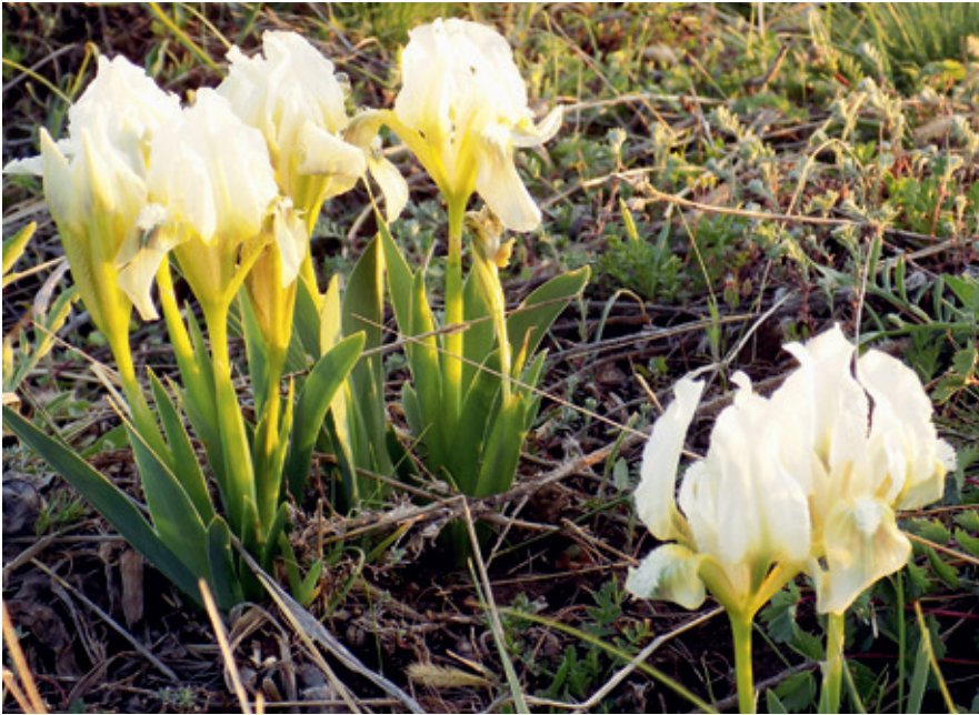
► Törpe nőszirm

Megjegyzem, az értékes területek és a növényritkaságok felsorolása korántsem teljes. Részben az értékek nagy száma miatt, részben az értékek egyedisége miatt sem lenne szerencsés ezek közhírré tétele, veszélyeztetése. (Így nem írok a kosborokról, amelyek különlegességük ellenére tömegesen pompáznak egy-két területen.) Szintén Pomáz lakott határán található a Kő-hegy oldala. Itt a Natura 2000 területek közé beékelődve van egy beerdősült terület, amelyen néhány kisebb rét található, ezek déli tájolásúak, csapadékban szegények, és szintén különleges növénytársulások otthonai. Árvalányhajak, különféle védett szegfűfélék és egyéb különlegességek mellett többek közt sok száz tő védett „nagyezerjőfű” is található itt. (Jelenleg ez a terület súlyosan veszélyeztetett, a 2018-as HÉSZ-ben beépítését egyedi szabályozással engedélyezték.)