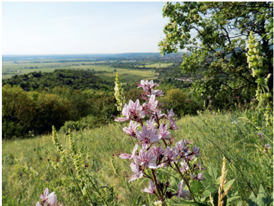
► Védett nagyezerjőfű is él Pomázon

Innen alig pár száz méterre a Kő-hegy tejein Pomáz és Szentendre közös határán kerül el az egykori kráter-tó. Mára már gyakran kiszárad, de pár éve még télen csúszkáltunk