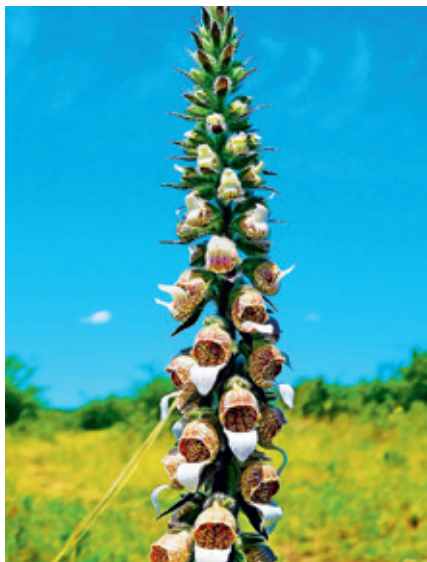
► Fokozottan védett gyapjas gyűszűvirág (Czimer Mihály képe)

Pomáz hosszan elnyúlóan a Dera mentén a Pilis hegység lábánál fekszik. Közben mélyen benyúlva a történelmi Pilisbe, a Visegrádi-hegységbe. Amikor a természeti szépsége