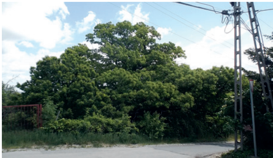
► Hatalmas szelídgesztenyefa

A másik jelentős természeti terület a Tófenék. Ez az egykori mocsárvilág (a Duna ártere volt) szintén különleges növény- és állatritkaságokat rejt. Hogy mást ne mondjak, él még ezen a területen egypár mocsári teknős is. A rét szárazabb részein ősszel tömegesen virágzik a réti őszirózsa. A peremén található egy mesterséges tó és két jelentősebb forrás is.