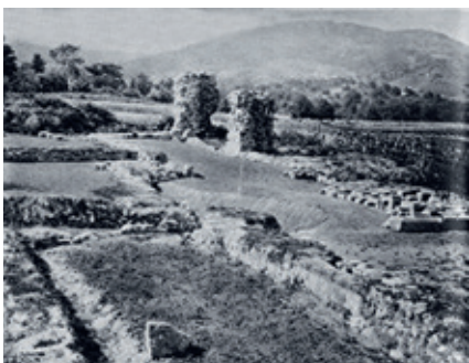
► Klisza romlelékei