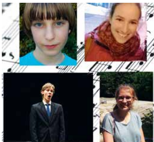
► A szolfézsverseny résztvevői

A csoportos órákat is átszerveztük az online térre, játékos feladatokat küldtünk