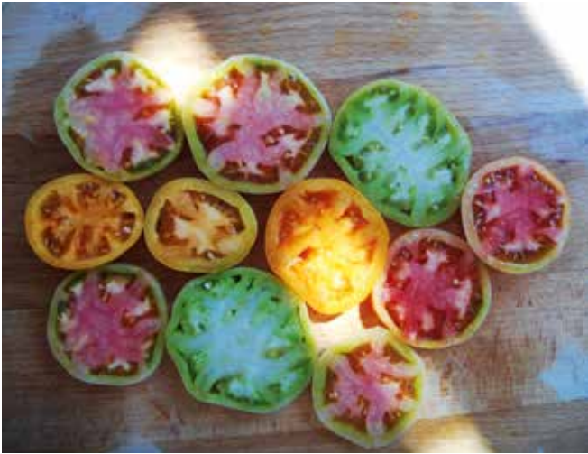
► Kiskerti paradicsomkarikák színkavalkádja

Vészterhes idöket élünk. A koronavírus-járvány miatt hozott intézkedések elvonulást, távolságtartást, otthonunkba történő bezártságot hoztak. Átalakulóban a világ. Míg korábban hozzánk messzi földrészekről jöttek látogatóba, most az ismerősökhöz, barátokhoz is csak karnyújtásnyira közelíthetünk. Míg korábban messzi földrészeket látogattunk meg, most itt ülünk saját érdekéből a négy fal közé szorítva. Egy kicsit megérint bennünket, hogy mennyire törekeny a világunk. A járvány egy-két hét alatt átírta a terveinket, sokaknak felborította a