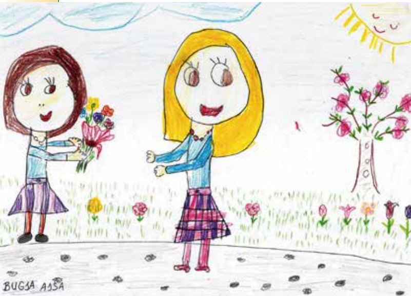
► A 7 éves Ágisa anyák napi rajza

Egy nagyon kedves, már elhunyt barátom, Jánosi András pomázi költő, író, festőművész verse jutott eszembe: