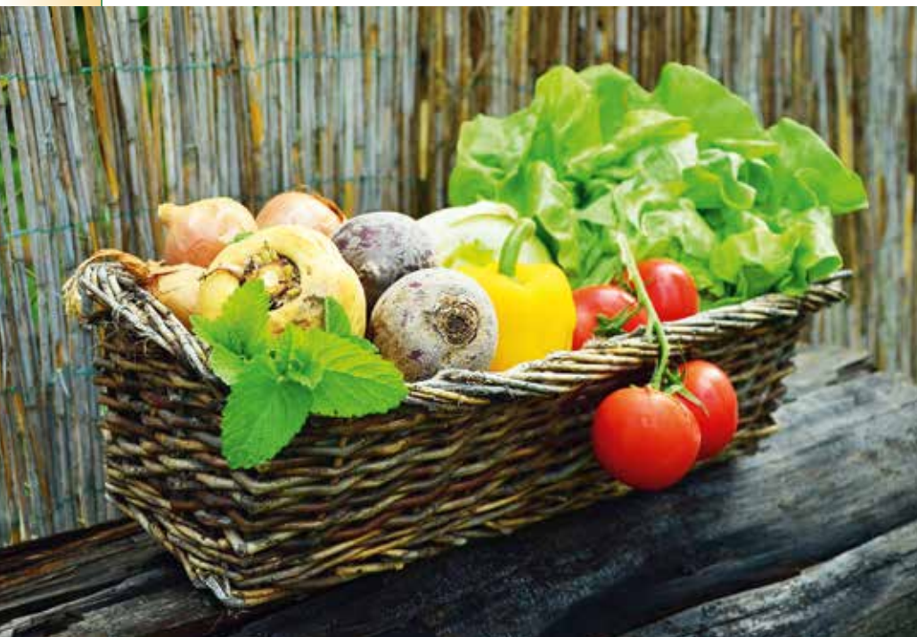
► Fontos a helyes táplálkozás

is erősítik a védekezőképességet, csökkentik a megbetegedési hajlamot. A központi idegrendszer számos ponton direkt módon, de áttételesen a hormonrendszeren keresztül is szabályozza az immunrendszer működését, ezen keresztül érvényesülnek az alvás, a pozitív gondolkodás és a jókedv, nevetés hatásai. Részben az idegrendszeren keresztül, de emellett a keringési és anyagcsere-hatásokon keresztül érvényesül a rendszeres és nem túl intenzív testmozgás hatása is, nyilván szép természeti környezetben, jó levegőn volna ideális, de jól szellőztethető szobában is hasznos végezni. Szintén idegi mechanizmusok révén hatékonyak reflexzóna terápiák, mint például a talpmasszázs. Ennek során a nyirokregiók mellett a máj és vese, illetve vastag- és vékonybél régiók masszírozása hasznos, de egyéni hajlam függvényében kiegészíthető a mandulák, melléküregek vagy a tüdők régiójával is. Érdemes itt említeni egyes akupresszúra pontok stimulációját is.