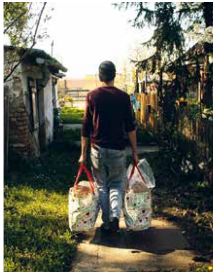
► Segítségnyújtás a rászorulóknak

Megmozdultak a pomázi lakosok is, nagyjából 30 önkéntes dolgozik a 70 éven felüliek bevásárlós csapatában, időt, energiát nem kímélve, teljesen ingyen! Köszönjük ezúton is