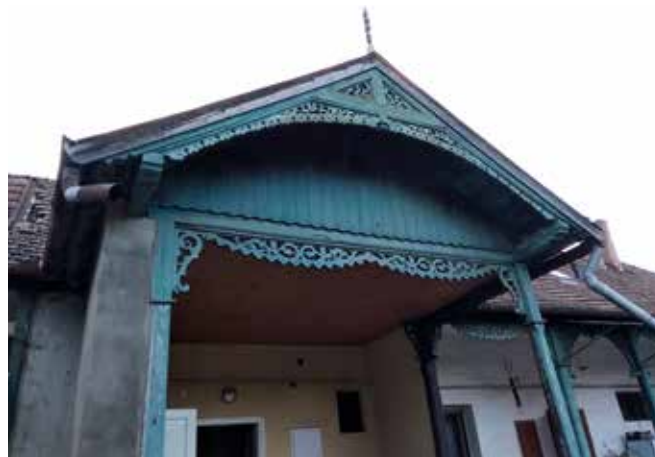
► A Mocsó-villa díszítőelemei