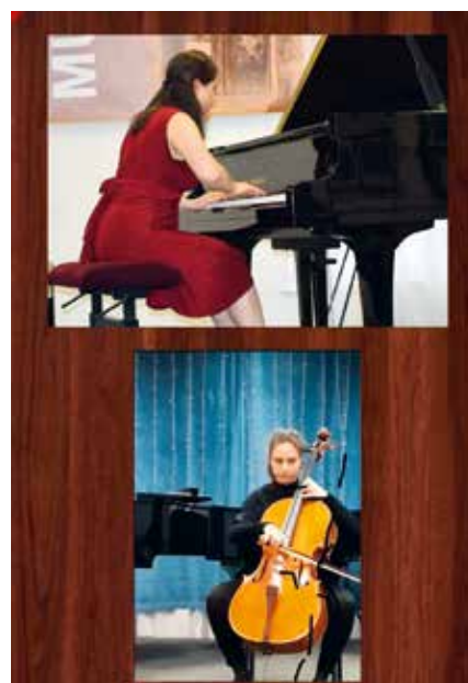
► Az Oltai Adrienne Országos Versenyre készült diákok

Tanulóink a házi feladatokat az EKRÉTA felületén is nyomon követhetik.