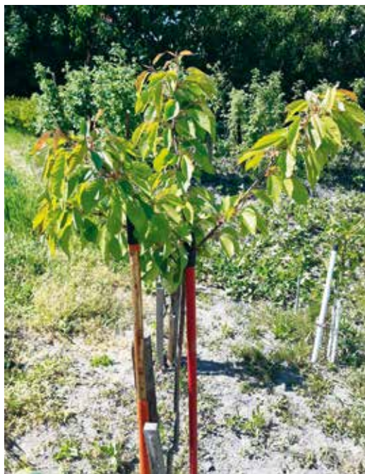
► Oltott cseresznyecsemete – 20 év múlva nagy fa lesz

Igen bőtermőnek mondható a fajta, jó ellenálló képességű, a gyümölcs húsa igen puha, így csak kézzel szedhető, ugyanezen okból a tárolást is rosszul tűri. Néhány napnál tovább nem tartható el, hamar