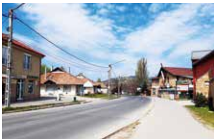
► Húsvéti „életkép” Pomázon

Húsvét az egyik legnagyobb keresztény ünnep, idén mégis üres templomokban zajlottak a szentmisék, istentiszteletek, amiket a hívek otthonról, az interneten követhettek. Üresek voltak az utcák, terek is, bezártak az üzletek. Pomáz nem fogadott látogatókat, a kirándulókat is megkérték, hogy később keressék fel a kedvelt turistahelyeket. Mindezek szükséges intézkedések voltak a járvány további terjedésének megelőzésére.