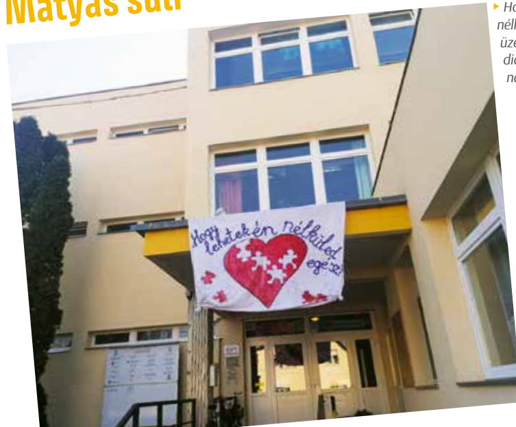
► Hogy lehetek én nélkülözhető? - üzeni a Mátyás suli diákjainak, dolgozóinak.