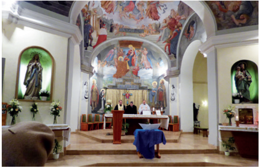
► Az imahét a katolikus templomban kezdődött.

Az idei imahetet két különleges alkalom is körülvette. A Duna TV január 19-én a pomázi katolikus templomból közvetítette élőben a vasárnapi szentmisét. Január 26-án pedig Szent Szávának, a szerb egyház és az iskolák alapítójának az ünnepe volt.