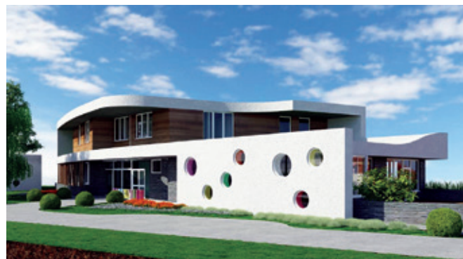
▶ Az új bölcsőde látványtervei

jelentette volna. A bizottsági ülés után és a testületi ülés előtt kaptunk egy részletesebb kimutatást. Ezen felfedeztem, hogy jóval több gázt fizettünk ki, mint a gázóra állása. Megkérdeztem, hogy mi az oka ennek. A városfejlesztési csoport felajánlotta, hogy utána jár. Kiderült, hogy a 2018-ban átalányban kiszámlázott összeg jó 3,5 millió forinttal magasabb volt, mint a tényleges fogyasztás. Ezt a pénzt azóta visszaigényeltük.