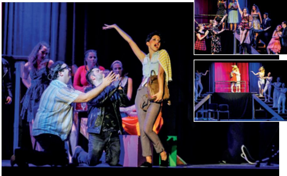
► Jelenetek a musicalből

A MADE in POMÁZ című retro-musical-paradéban örökzöld slágereket, és népszerű musical jeleneteket láthatnak és dalokat hallhatnak a nézők, ami minden korosztály számára kellemes időtöltést nyújt, természetesen „Pomázosan”. A művészek eljátszák és megidézik a régi idők hazai és külföldi hangulatát: zajlanak az események, járnak a lábak, pörögnek a szoknyák, csattannak a csókok, és szól a Rock and Roll. Többek között olyan hazai dallamok csendülnek fel, mint a 220 felett , Santa Maria , Valaki mondja meg , Holnap hajnalig , Meghalok, hogy ha rám nézel vagy a tengerentúli mára már kultikussá vált Grease , vagy éppen a Mamma Mia című musicalek jelene-