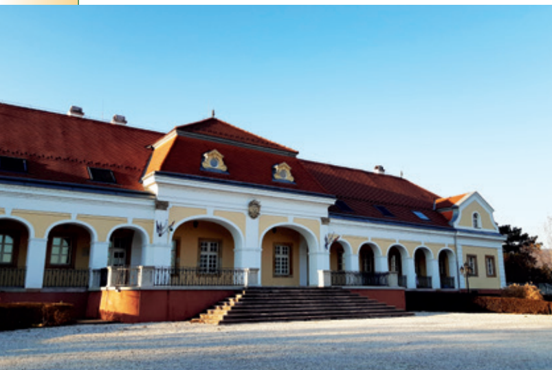
▶ A Teleki-Wattay kastély ismét számos rendezvény otthona lesz