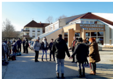
► Az Opanke flashmobja igazi vásári hangulatot varázsolt

Hát igen! Ilyen hangulat kellene minden szombat délelőtt a piacra. Jóízű beszélgetések és falatok, jó zene és tánc.