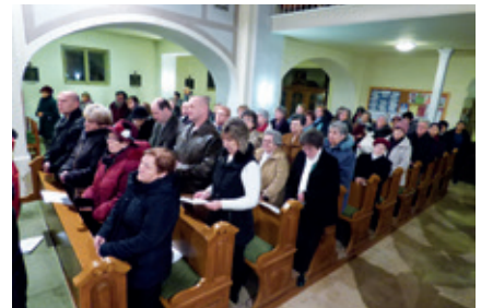
► Minden este megteltek a templomok a közös imára