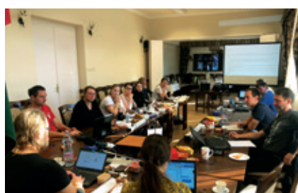
► Lovasíjászok nemzetközi képviselőinek találkozója a városházán

még biztonságosabb megmérettetést biztosít, de ötvözi a különböző lovasíjász technikát alkalmazó stílusjegyeket is, figyelembe véve a nemzeti sajátosságokat és hagyományokat. Emellett szó esett a versenyztetés, az utánpótlásképzés szakmai és technikai fejlesztésének további lehetőségeiről, a szö-