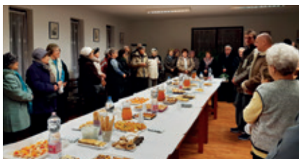
► Istentisztelet utáni szeretetvendégség