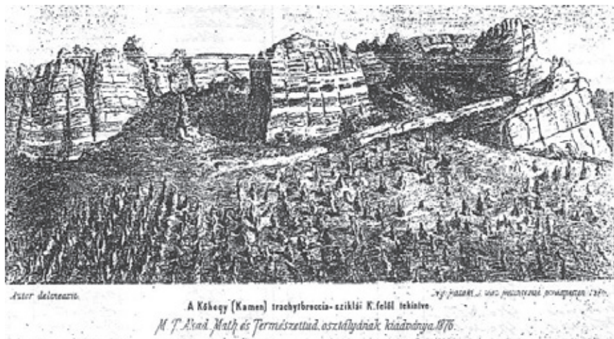
▶ A kőhegyi szőlők a filoxéra pusztítása előtt

Sajnos, az 1874-ben kitört filoxéra járvány ezt a fejlődést megtörte, sok gazda ekkor teljesen tönkrement, mivel mire megtalálták a filoxéra bogár ellenszerét, a szénkénegezést, addigra a pomázi szőlők elpusztultak. Pár tehetősebb gazda próbálkozott ellenálló amerikai fajták telepítésével. Többen ekkor tértek át a gyümölcsstermesztésre. Amit nem pusztított el a filoxéra, azt tönkretette