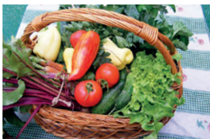
► Kosárnyi vegyszermentes zöldség a saját kertünkben

A 19. században a növénytermesztésben új korszakot indítottak el. Mozgatórugói az új technológiák, a kemizálódás, valamint a gépesítés volt. Az eredmények – a nagyobb termésátlag, a gyorsabb, hatékonyabb munkavégzés, nagyobb gazdasági fejlődés – beigazolni látszott a feltevést, hogy az ember a gondolkodás révén uralma alatt tarthatja a természetet, a környezetet. Mindezen fejlődés azonban nem az ökológiai, hanem az öko-