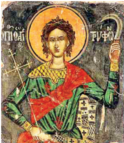
▶ Szent Trifun legrégebbi ismert ábrázolása egy kolostorfreskón

Február 14-én az ortodox keresztények minden évben megtartják Szent Trifun ünnepét, aki a szőlészek, borászok, vendéglősök patrónusa.