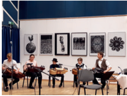
► A zeneiskola növendékeinek előadása