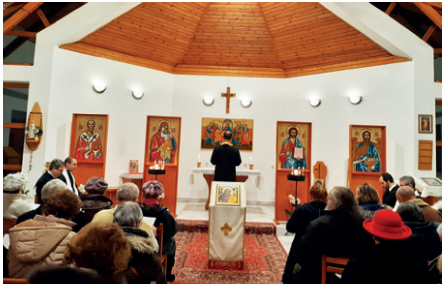
► A Karitás ház Szent Miklós kápolnijában görögkatolikus Istentisztelet volt