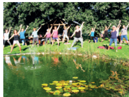
► Egészségfejlesztés Etka jógával

Az EJRE szervezésében március hónaptól heti rendszerességgel tartunk ingyenes Etka jóga alapszintű tanfolyamot a Művelődési Házban. Szeretettel várjuk mindazokat, akik szívesen csatlakoznak egy életvidám, önmagáért és a közösségért tenni akaró táborhoz.