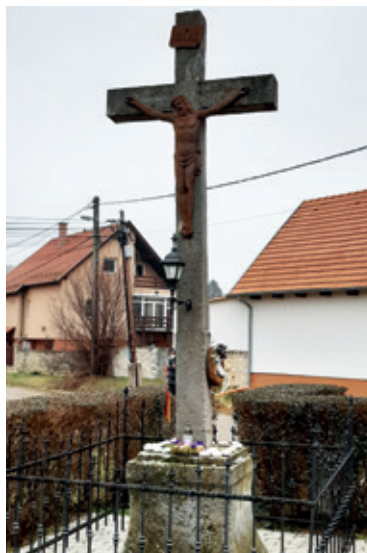
➤ Sváb kereszt, az egyik számon tartott helyi értékünk

A PBT tagjai úgy gondolják, hogy az értéktár javaslatok kezelésekor a törvényi kötelezettségéből adódó forraságok terhére le kell venni az értéket leíró, azt benyújtó válláról. Lehetőség szerint segíteni kell a munkáját akár az értékhez kap-