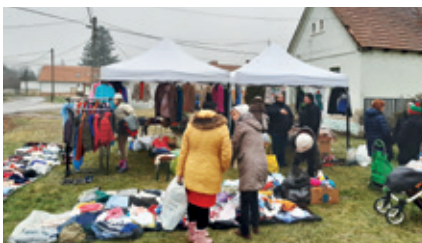
► Ruhabörze a Diófa utcában

A felvégi lakótársaink kérték, hogy a ruhabörzénket vigyük el hozzájuk is. A ruhák mellé játékokat, gyerek mese DVD-ket is felpakoltunk. Ismét sikerült egy jó pár embernek örömet okozni.