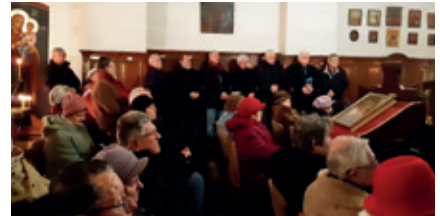
► Csütörtökön a szerb ortodox gyülekezet volt a vendéglátó