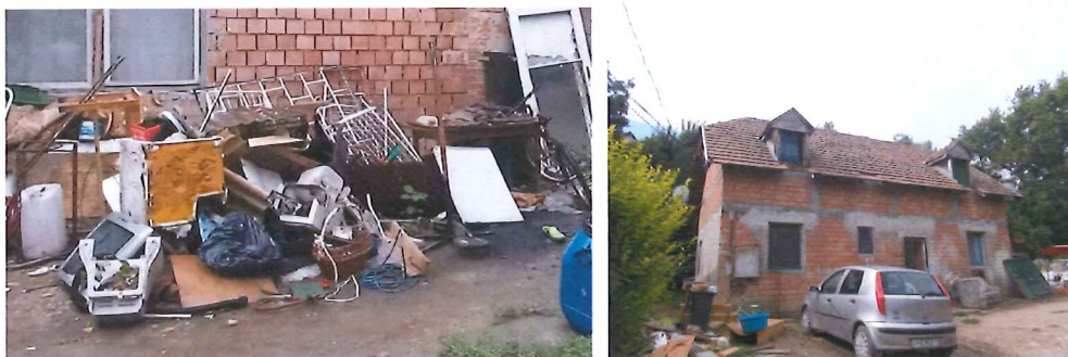
Az ingatlan korábbi állapota.

A területrész értékére értékbécslés készült, amely figyelembe vette a terheléseket, továbbá a terület állapotát.