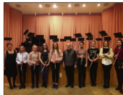
A Fuvolaegyüttes sikeres szereplése

Az iskolában a tavasz kezdetén sem maradnak el a színesebbnél-színesebb programok. Február 23-án kerül megrendezésre a Dunakanyari Ifjú Muzsikusok Találkozója, melyen az iskolát igen népes diákcsapat képviseli majd. Illetve izgalmas kezdeményezéssel vár mindenkit február 28-án, csütörtökön este 7 órakor az iskola Hangversenytermében a moderntánc tanszak, ahol egy különleges improvizációs est keretében ismertetik meg ez érdeklődőket a tánc szépségeivel.