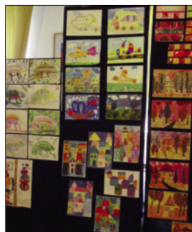
A képzőművész tanszak kiállítása