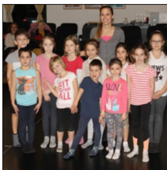
A moderntánc tanszak bemutató órája

A pályázat mellett a tanszakok is sikeresen zárták a félévet, az iskola komolyzenei tanszakai, jazztanszaka, képzőművész-, moderntánc- és dráma tanszaka is színvonalas vizsgákra, valamint kiállításra és bemutató órákra várta az érdeklődő szülőket és ismerősöket.