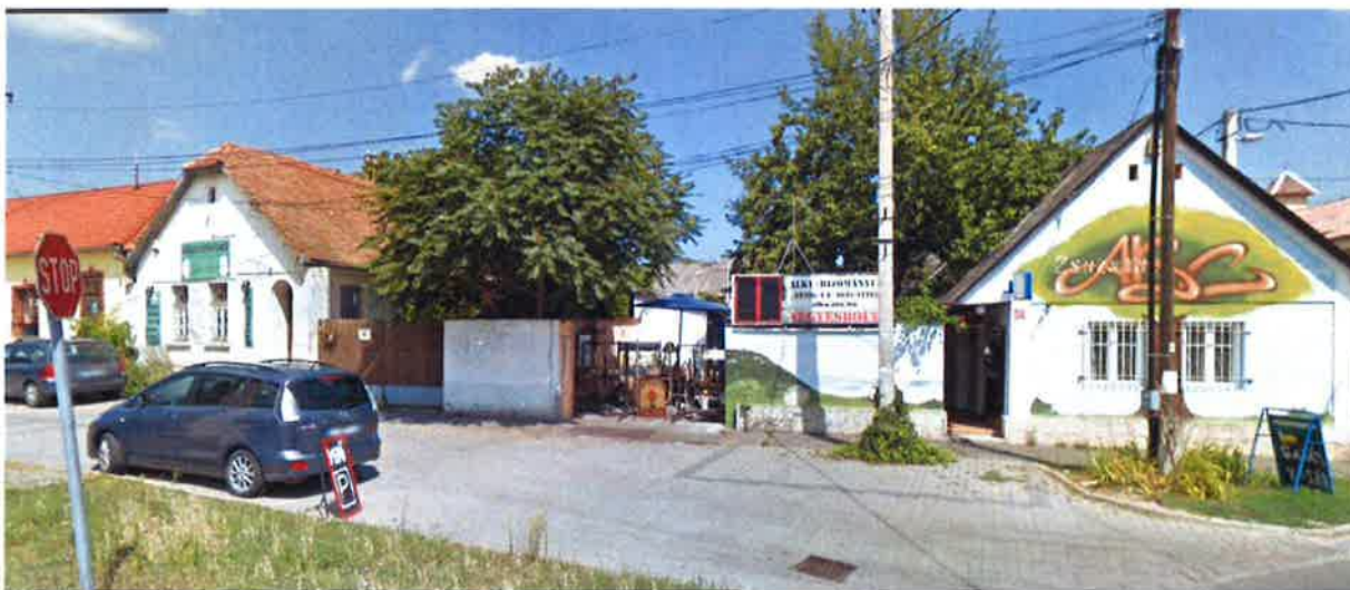
Hősök tere felőli nézet a bontás előtt

Meglepődve észleltük, hogy a Pomáz Hősök tere 413 és 414 hrsz.-ú ingatlanokon korábban állt épületeket néhány héttel ezelőtt elbontották.