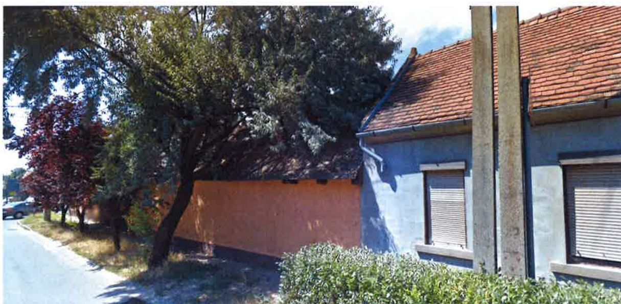
Fáy u. felőli nézet a bontás előtt