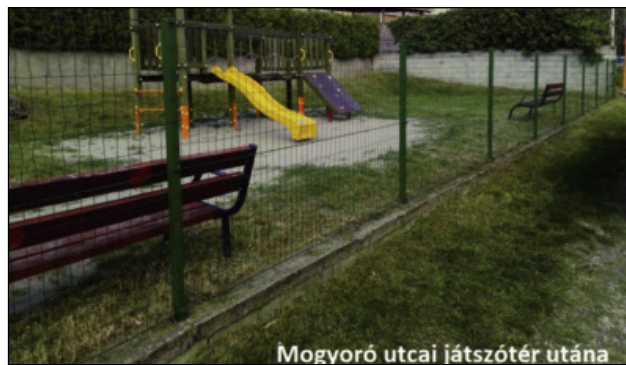
Mogyoró utcai játszótér utána