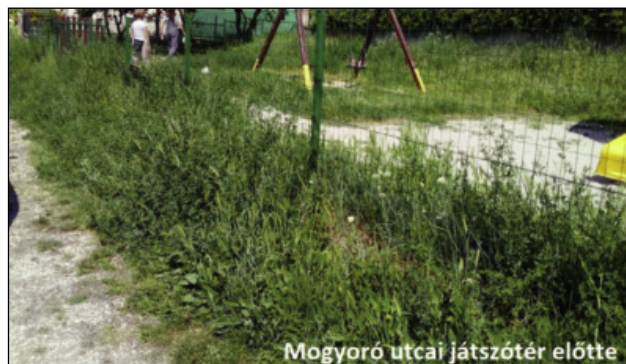
Mogyoró utcai játszótér előtte