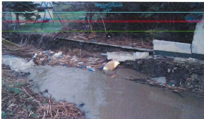
Részlet a partfal leomlásról

2018. április 1-én a hivatalban lakossági bejelentést kaptunk, hogy partfalomlás történt a Pomáz, Dera patak mentén a 1545 és 1544 hrsz.-ú ingatlan mögött, a Dera patak 1529 hrsz.-ú oldalán. A Pomáz 1529 hrsz.-ú ingatlan önkormányzati tulajdonú. Az omlás következtében az ingatlanok kerítése a mederbe dőlt amitől a patak medre megváltozott, a víz megduzzadt, a folyás lelassult, torlódás következett be. A meder helyreállítása és a hordalék kotrása után kb.: 30 fm hosszban vízepítési terméskövel történt.