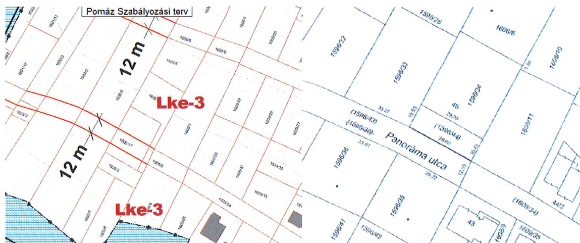
A Helyi Építési Szabályzat

Pomáz Város Önkormányzata 1/1 tulajdonában van a Pomáz 1596/30 hrsz.-ú Panoráma utca szakasza. Az utcának a 1596/34 hrsz előtt 312 m 2 nagyságú területe természetben a lejtési viszonyok miatt közterületként nem használható, továbbá nem indokolt az utca vonalvezetése miatt. Amennyiben Pomáz Város Önkormányzata a lenti telekalakítás során kialakítja a 1596/44 hrsz.-ú kivett közforgalom elől el nem zárt magánutat, valamint forgalomképesé teszi, lehetőség nyílik az ingatlan hasznosítására.