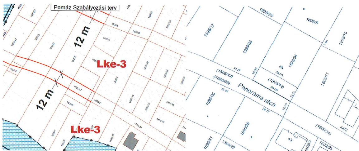
A Helyi Építési Szabályzat